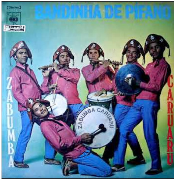
Figura 1 - Banda de pífano de Caruaru