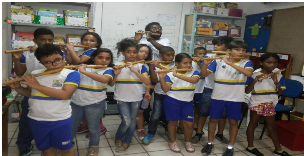
Figura 8 - Bandinha Severina Lira

Apesar de terem apresentado interesse e rendimento nas atividades, foi observada uma desmotivação dos alunos no período de adaptação, pois tivemos que conciliar a oficina durante o turno escolar, essa questão refletiu na assiduidade do grupo e na prática diária do instrumento