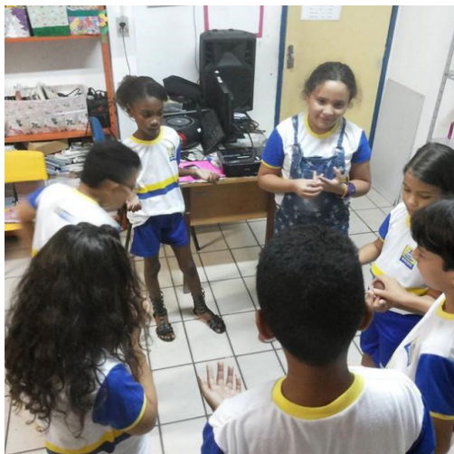
Figura 6 - Atividade jogos musicais