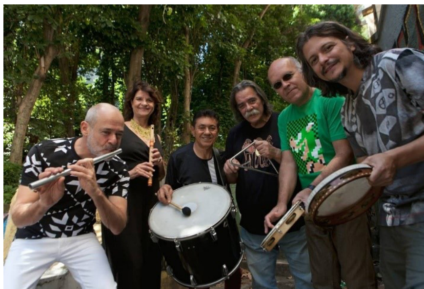
Figura 3 - Pife Moderno

Em virtude da grande profusão de nomes e “confusão” das características na classificação do instrumento, optou-se pelo termo “pife” por ser esta a forma de uso corrente usada pelos dois pifeiros contatados da região agrestina do estado de Pernambuco no Nordeste brasileiro 62. Além disso, o termo é útil para evitar as confusões entre a referência ao instrumento nordestino e aos seus assemelhados em contex-