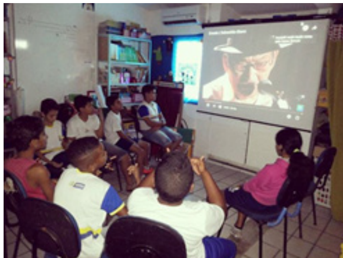
Figura 7 - Aula expositiva documentário sobre Sebastião Biano

A avaliação formativa assume todo seu sentido no âmbito de uma estratégia pedagógica de luta contra o fracasso e as desigualdades, que está longe de ser sempre executada com coerência e continuidade. (PERRENOUD, 1999. p. 9)