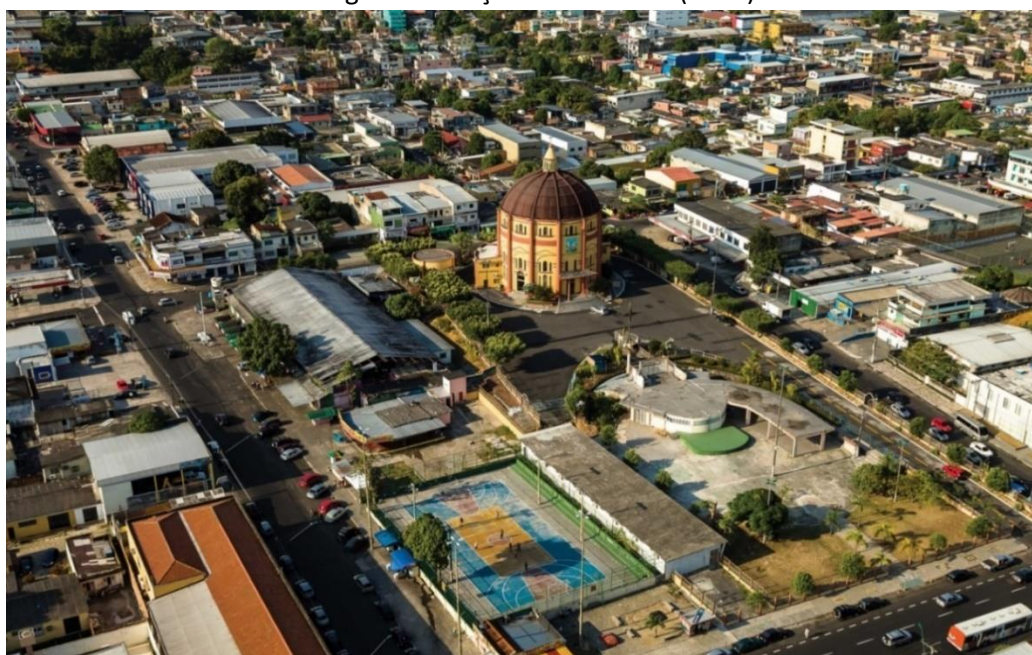
Imagem 2 - Praça 14 de Janeiro (2012)