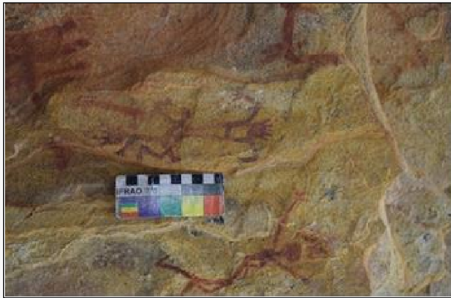
Figura 07 – Cena de Sexo com pessoas do mesmo sexo biológico, provavelmente, representações de dois antropomorfos de gênero feminino. Toca do Pinga do Boi. Parque Nacional Serra da Capivara – PI. Foto de 2018.

Os antepassados indos-europeus-asiáticos, realizaram diversas representações de antropomorfas, geralmente esculpidas em marfim ou em pedra que destacavam traços sexuais do gênero feminino. Foram encontradas, também, estatuetas onde as representações dos órgão sexuais não definidas, deixando a impressão de serem andróginas (Adovasio, Soffer & Page, 2009). Os artesãos pré-históricos, tinham como seus objetivos o foco tanto na criação das representações de mulheres quanto nas representações de androginia. No caso de uma provável analogia ou comparação com as pinturas rupestres encontradas no PNSC, evidenciamos uma cena que apresentaria uma relação sexual de duas figuras antropomórficas com feições relacionadas ao gênero feminino (Figura 07) (Justamand et al., 2019a).