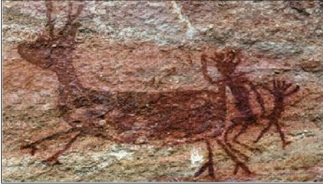
Figura 05 – Cena da penetração entre representações antropomorfas, com falo, “homem”, e um animal, não humano. Ainda ocorre uma outra representação antropomórfica, aparentemente, “masculina” segurando o falo de outra, também “masculina”. Toca do Caldeirão dos Rodrigues. PNSC. Foto de 2018.

Lins (2012) sugere que entre os grupos de caçadores e coletores existia a exogamia, em outras palavras, acredita-se que esses pudessem copulavam com indivíduos de fora do seu meio, sendo provável que ocorressem celebrações, cerimoniais e eventos sociais habitualmente entre eles. Tais encontros possibilitavam diversas conjunturas, como o aprimoramento das redes políticas, econômicas, sociais e sexuais. Justamand (2010), relata e descreve representações de muitos antropomorfos juntos e “comemorando” tendo, no mesmo enquadramento cenográfico, a presença de relações sexuais (Figura 06).