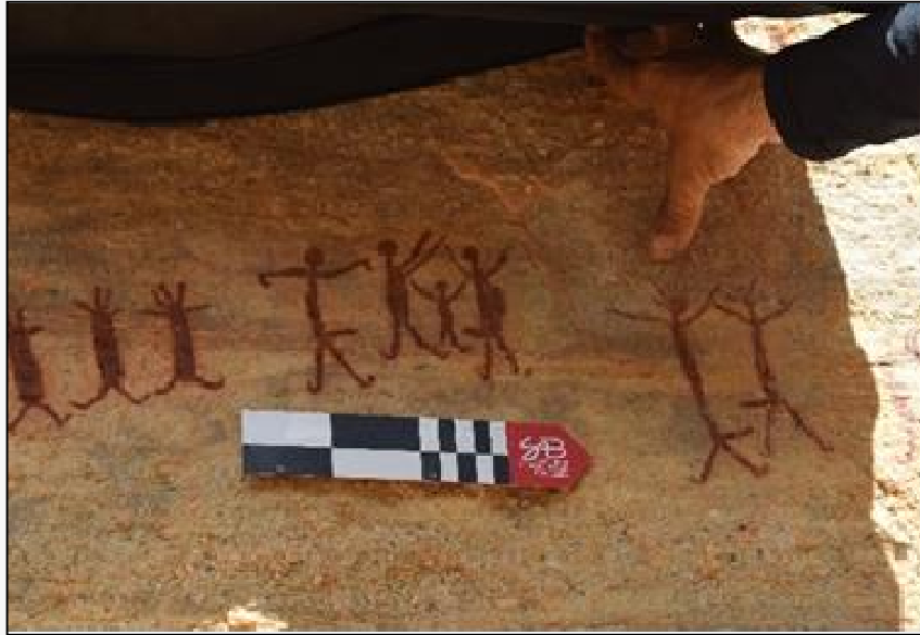
Figura 08 – Cena de falos eretos e de homens com seus falos um de frente para o outro. Toca do Sítio do Meio. PNSC. Foto de 2018.

com mais de 12 mil anos. No mesmo estudo o autor destaca a presença de bastões “fálicos”, alguns com nítidas de representações penianas, às vezes mais de um na mesma cena. Alguns desses falos foram feitos em marfim, onde, possivelmente, poderia ser utilizado para inserções/penetrações vaginais, orais ou anais (Taylor, 1997).