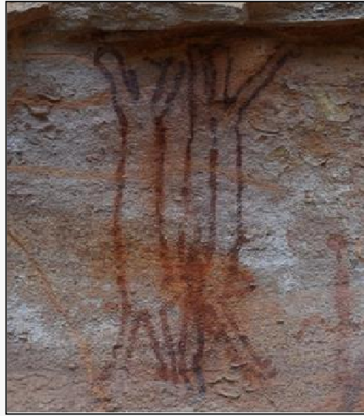
Figura 04 – Cena da penetração/relação sexual entre duas representações de antropomorfos “masculinos”, graças a presença, em ambos, de falos. Toca Boqueirão da Pedra Furada. PNSC. Acervo dos autores. Foto de 2018.

Vestígios rupestres representando cenas de feição sexual, foram encontrados na Austrália, na Itália (Dubal, 2017) e na Rússia (Mykhailova, 2017). Afixados em suportes rochosos, imaginações sobre as diversas práticas sexuais que consideravam visíveis e possíveis tornaram-se condição indispensável da espécie humana, ao que tudo indica, desde milhões de anos atrás, a divulgação desses intentos que, de alguma forma ficaram para a eternidade (Justamand et al., 2019a).