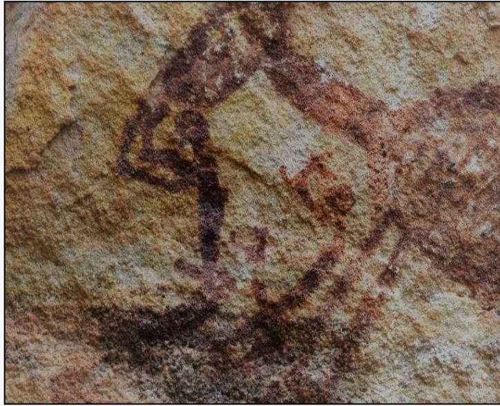
Figura 09 – Cena da representação da penetração entre dois antropomorfos de mesmo sexo biológico, por apresentarem os falos. Boqueirão da Pedra Furada – BPF. PNSC. Acero dos autores. Foto de 2018.