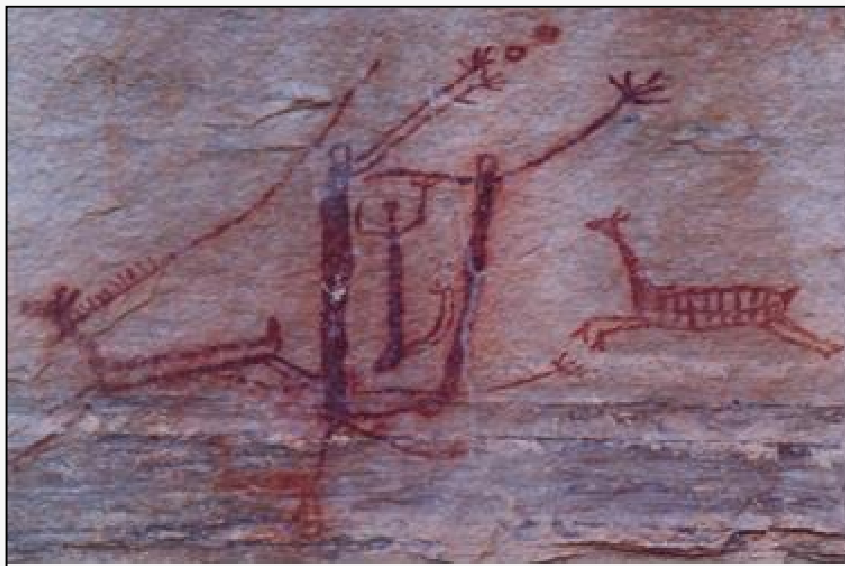
Figura 03 – Cena da representação de dois antropomorfos, um masculino, com seu falo, e outros virados de costas, podendo indicar um ato sexual. Toca do Pinga do Boi I. PNSC. Foto de 2018.

Taylor (1997), descreve que os ancestrais do homem moderno, dispersos por todos os continentes, deixaram vestígios arqueológicos que promovem o entendimento das múltiplas formas de relacionamentos sexuais, bem como, a penetração anal masculina, aferida em uma cerâmica peruana, datada de 600 anos depois da era cristã. Nas áreas do PNSC, identificamos de forma similar, cenas de penetração de figuras antropomorfos do mesmo sexo (Figura 04) (Justamand et al., 2019a).