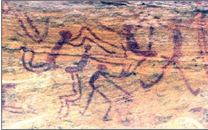
Figura 02 – Cena do sexo grupal. Toca do Baixão do Perna IV. PNSC. Foto de 2018.