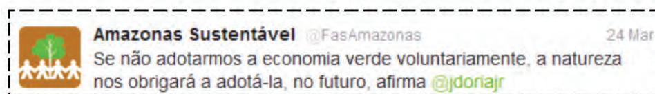
Figura 8. Exemplo 2 da Categoria Declaração de Líder de Opinião Pública.

Nesse aspecto relacionamos diretamente ao Capital Social Cognitivo (que compreende a soma do conhecimento e das informações colocadas em comum por um determinado grupo). Acredita-se que a utilização destas atualizações com citações pode ser considerada uma forma de legitimar as ações desenvolvidas pela entidade, assim como uma forma de disseminar posicionamentos que tenham afinidade aos da FAS.