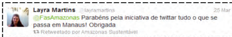
Figura 10. Exemplo 1 da Categoria Interação com o seguidor.

A seguir alguns exemplos de Capital Social Relacional (que compreende a soma das relações, laços e trocas que conectam indivíduos de uma determinada rede) por meio da categoria interação com o seguidor (14%), na qual a entidade estabelece um contato direto com seus seguidores.