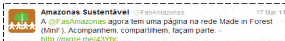
Figura 3. Exemplo 1 da Categoria Indicação de links.

Entende-se que o Capital Social Relacional (que compreende a soma das relações, laços e trocas que conectam indivíduos de uma determinada rede) é expresso por meio da Categoria indicação de links (18%), visto que equivale às atualizações que sugerem ao seguidor o redirecionamento para outras ambiências digitais que guardam relação direta com a área de atuação da entidade. Pode-se exemplificá-la por meios destes tweets :