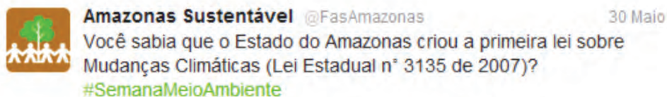
Figura 9. Exemplo 1 da Categoria Notícia com base em fonte externa.