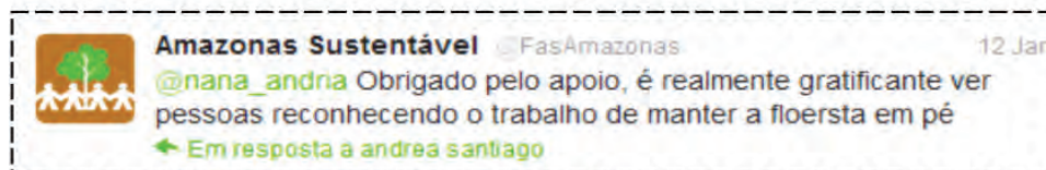
Figura 11. Exemplo 2 da Categoria Interação com o seguidor.