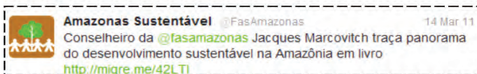
Figura 6. Exemplo 2 da Categoria de Opinião de Membro da FAS.