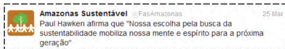
Figura 7. Exemplo 1 da Categoria Declaração de Líder de Opinião Pública.

Outra categoria, a Declaração de líder de Opinião Pública (13%), também está ligada ao discurso de autoridade, contudo as atualizações destacam considerações sobre questões ambientais ou comentários sobre a atuação da FAS feitas por líderes de opinião pública (jornalistas, ambientalistas, empresários, dentre outros).