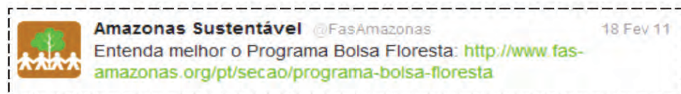
Figura 4. Exemplo 2 da Categoria Indicação de links.

Fonte: http://twitter.com/#!/fasamazonas