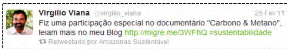
Figura 5. Exemplo 1 da Categoria de Opinião de Membro da FAS.

Outra estratégia utilizada na tentativa de construção de uma imagem positiva foi verificada nos tweets da categoria Opinião de membro da FAS (12%), que corresponde ao Capital Social Normativo (que compreenderia as normas de comportamento de um determinado grupo e os valores deste grupo). Nessas atualizações as ideias, pensamentos, assertivas dos membros organização são citadas: