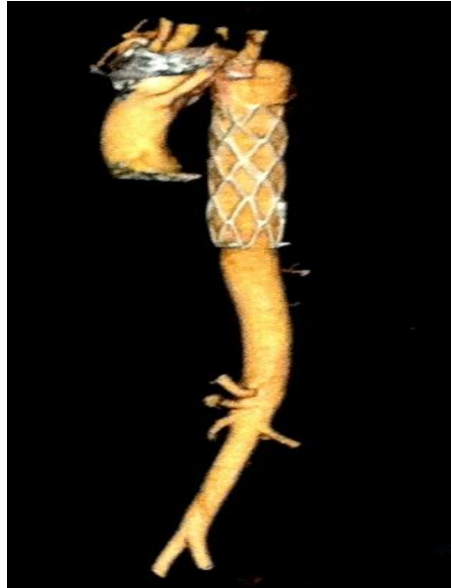
Figura 2. Stent aórtico implantado e oclisor na Origem da artéria subclávia aberrante.

A broncoscopia realizada após dois anos de tratamento não mostrou sinais de compressão do brônquio fonte direito. Paciente mantinha queixa esporádica de tosse, porém realiza suas atividades habituais normais, com prática de exercícios físicos sem restrições.