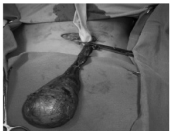
Figura 3: Orquiectomia radical demonstrando controle dos vasos espermáticos.