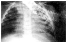
Figura 2. Este é um importante sinal nas pneumonias alveolares.

Figuras 1a e 1b. Aerobroncogramas de uma patologia intrapulmonar.