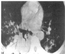
Figura 4. O aerobroncograma nos permite deduzir que segmento brônquico constatado pelo ar está permeável.

Figura 3. Este sinal é devido à perda da aeração alveolar com aeração brônquica preservada.