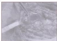
Figura 6. Traqueoplastia após ressecção de área da traquéia que apresentava a estenose

A anastomose é feita com uma sutura posterior na sua porção membranosa sendo usado chuleio contínuo e os anéis traqueais com pontos separados, sempre se utilizando fio absorvível. No fechamento da incisão devemos observar se o tronco arterial braquiocefálico está cruzando a anastomose, pelo risco de sangramento. Em nossa casuística,