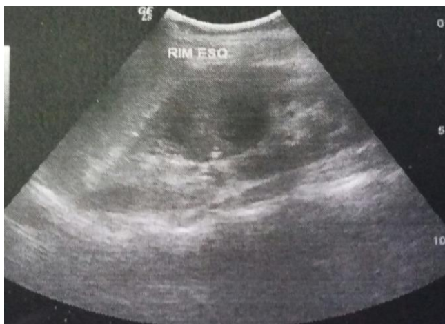
Figura 2: Ultrassonografia pré-cirurgia. Arquivo pessoal