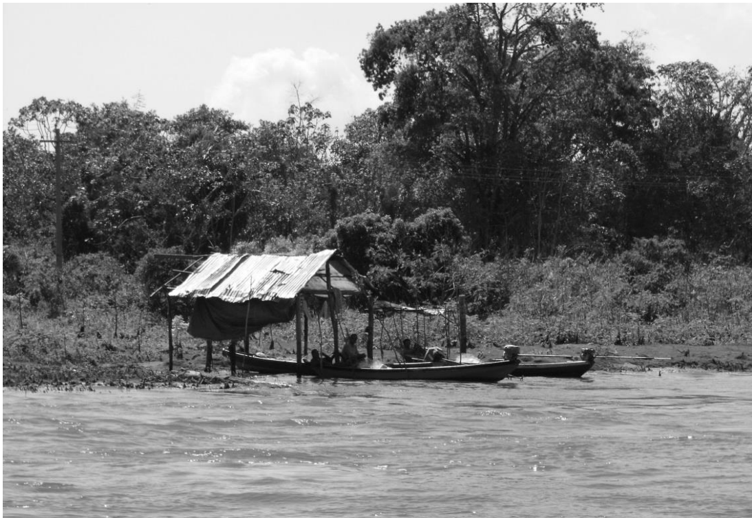
Figura 3: Ativação do lanço: pescadores no sistema de espera da vez. Fonte: Nascimento. Trabalho de campo, 02/08/2014.

Os lanços de pesca são instalados por volta do mês de março, quando o nível das águas do rio Amazonas está elevado, e são encerrados aproximadamente no mês de setembro, quando o nível das águas está baixo após o término da migração dos peixes na piracema.