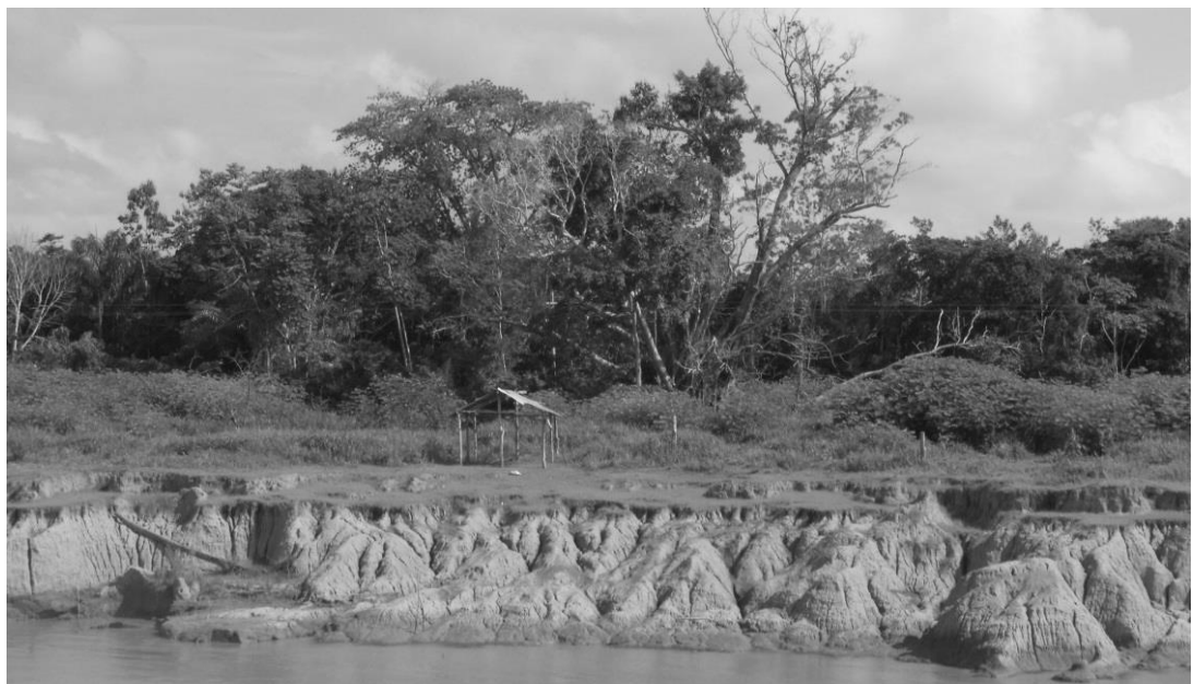
Figura 4: Desativação do lanço de pesca.

Os lanços de pesca são instalados por volta do mês de março, quando o nível das águas do rio Amazonas está elevado, e são encerrados aproximadamente no mês de setembro, quando o nível das águas está baixo após o término da migração dos peixes na piracema.