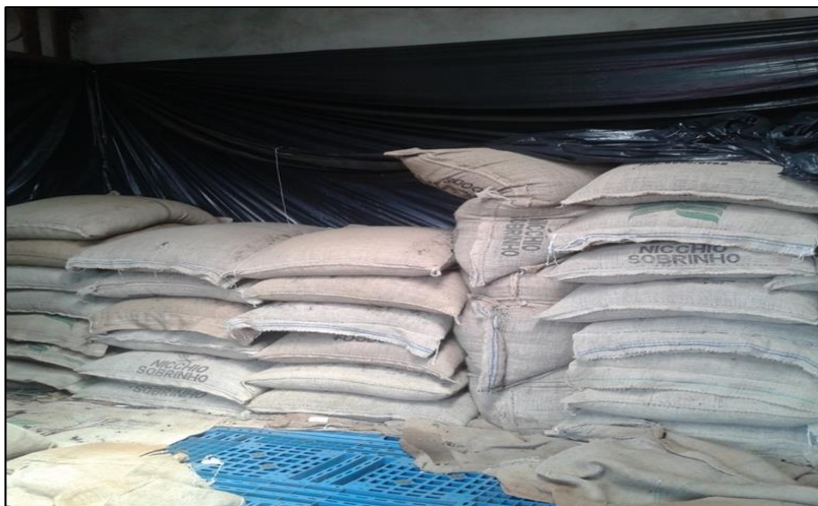
Figura 7. Estoque de guaraná em rama comercializado pelos atravessadores.

desde os preços ao fomento da produção camponesa. Os atravessadores compram guaraná de qualquer cultivador, não importando a quantidade (figuras 07), mas sim a qualidade, pois se não tiver nos padrões da empresa, certamente não haverá negociação, por isso, a necessidade dos atravessadores obterem “produtores de confiança”. É importante também destacar que nem todos os camponeses estabelecem relações de integração junto aos atravessadores, geralmente apenas os cultivadores de destaque na produção do guaraná.