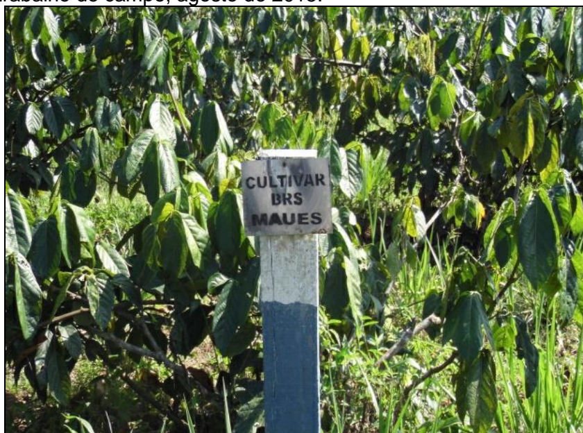
Figura 3. Campo experimental da Embrapa-Maués.