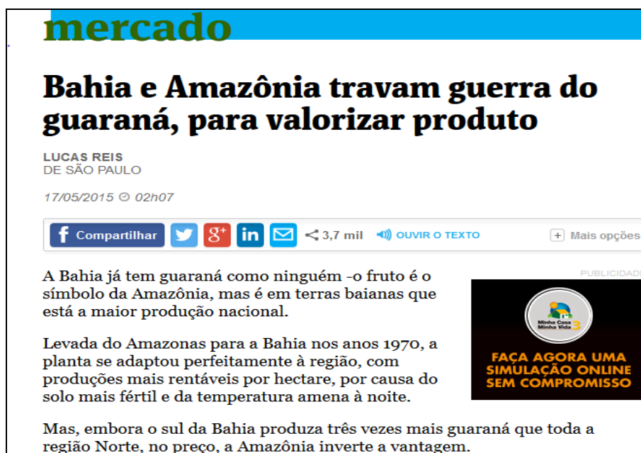
Figura 4. Reportagem da folha de São Paulo sobre a guerra do guaraná. Data: 17.05.2015.

Para tentar reverter essa situação os produtores baianos criaram a marca “guaraná da mata atlântica”, uma forma de valorizar seu produto no mercado, que ainda prefere o guaraná da Amazônia, porém, diante dessa situação os amazonenses responderam à altura, exigindo do Ministério da Agricultura o selo de Indicação Geográfica (IG), que atribui reputação, valor intrínseco e identidade própria ao produto. Assim, como destacou no ano de 2015 a reportagem do jornal paulista “Folha de São Paulo” (figura 4), os dois estados travam uma verdadeira guerra pela valorização do seu guaraná.