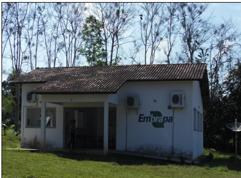
Figura 2. Embrapa, sede Maués-AM.

No campo experimental da Embrapa são cultivadas 18 variedades de clones em 08 parcelas demonstrativas, com 35 plantas para cada parcela, incluindo uma variedade de 03 espécies de clones por parcela. O destaque maior é para as espécies do tipo: Mundurucânia, BRS Luzea, Cereçaporanga, Cultivar BRS e BRS-Maués (figuras 2 e 3), este último produzido em parceria com a AmBev, e que é atualmente o mais distribuído para os camponeses.