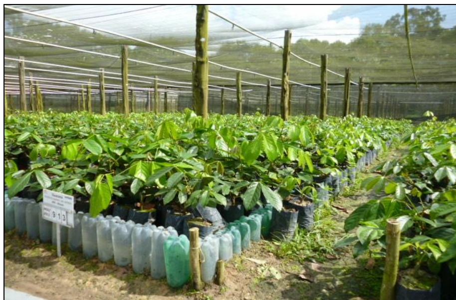
Figura 5. Viveiro de guaraná na Fazenda Santa Helena.

Nesse contexto, nasceu a Fazenda Santa Helena, um grande viveiro de mudas e um laboratório de estudos sobre a cultura do guaraná. Em parceria com a Embrapa, os agrônomos têm pesquisado as melhores técnicas para o plantio comercial: espaçamento, tamanho da cova, adubação, seleção das espécies mais produtivas e resistentes a pragas. Os conhecimentos adquiridos são compartilhados com os produtores locais, o que alterou a forma de parte dos agricultores executarem o plantio do guaraná. Algumas plantações espalhadas deram lugar ao cultivo planejado, com utilização de mudas distribuídas pela prefeitura, em parceria com AmBev e Embrapa (ALMEIDA, 2007, p.49).