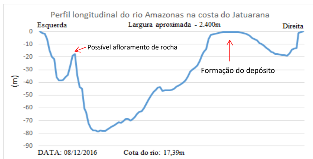
Figura 2. Perfil transversal do rio Amazonas na costa do Jatuarana. Org: ARAÚJO, 2017

No entanto, a partir das medições batimétricas dos perfis transversais (Figura 2), foi possível observar que as maiores alterações estão ocorrendo no leito do rio, ou seja, através do processo fluvial denominado de depósito de canal.