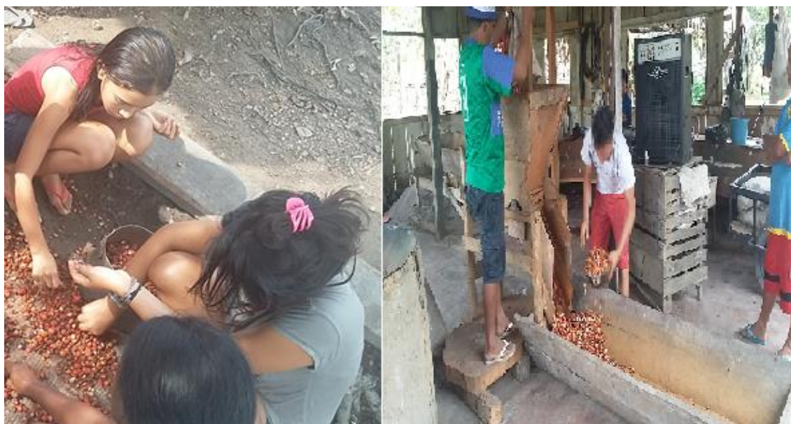
FIGURA 4 - 5: Unidade de produção, temos a família trabalhando manualmente com o guaraná, na figura (5) a presença de máquina, no qual facilita a força de trabalho.