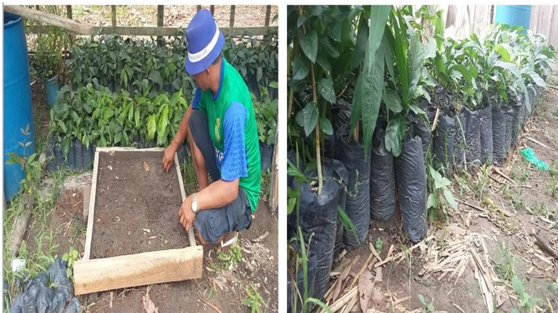
FIGURA 2 - Processo de cultivo do guaraná.