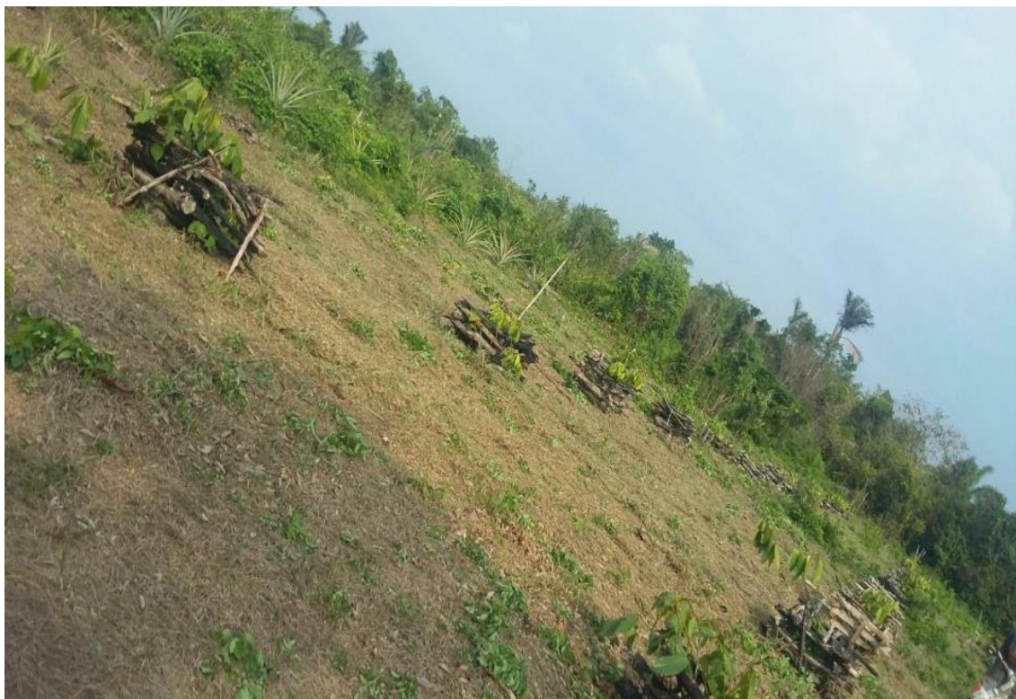
FIGURA 3 - Roçados de guaraná, cultivados em forma de linha na comunidade Divino Espírito Santo do Castanhala- Barreirinha/AM.