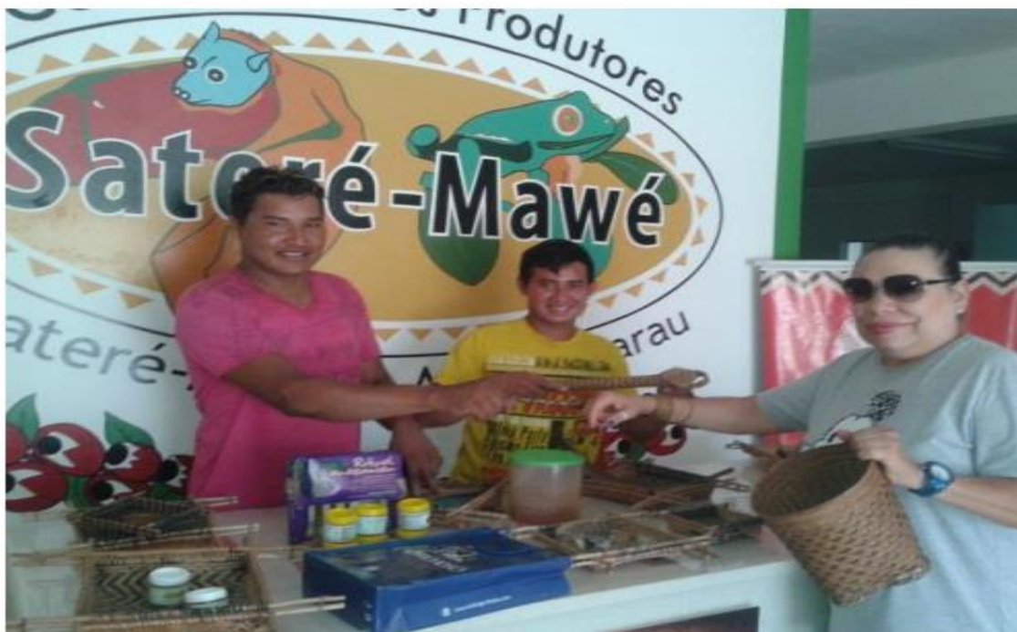
FIGURA - 6- Consócio Sateré- Mawé em Parintins.

Imagem dos camponeses no ato de comercialização: