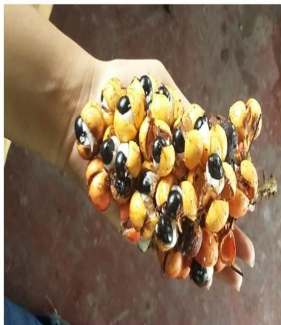
FIGURA 7 e 8: As sementes do guaraná são em ramas