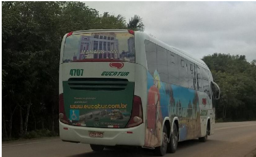
Figura 1. Ônibus de uma empresa que atua em diversos estados do Brasil e que possui, na lateral, imagens que remetem a uma região, e na parte de traz, uma imagem de um objeto geográfico que possui um significado histórico ou em outro veículos a representação é de elementos naturais. Fonte: NETO, em 01 de maio de 2017 na rodovia AM-010 (Manaus-Itacoatiara).

Os veículos observados nas rodoviárias e ao longo das rodovias (fig. 1) estampam elementos representativos dos lugares, com imagens de objetos geográficos, caracterizados como artefatos carregados de significados históricos, religiosos, festivos e de aventuras, com o objetivo de induzir o futuro passageiro a viajar para um dado lugar, optando por essa ou aquela determinada empresa de transporte.