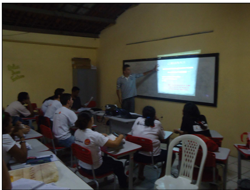
Figura 03: Aula de climatologia com a utilização de recursos midiáticos.

Antes de verificar as respostas dos questionários, listamos alguns questionamentos para conduzir as análises que seriam realizadas com as respostas obtidas, dentre elas: a) O uso de diversas ferramentas pedagógicas, principalmente o uso das TIC's interferem diretamente na aprendizagem de conceitos climatológicos? b) Os conhecimentos adquiridos pelos alunos a partir de suas vivências escolares no âmbito da Geografia e mais precisamente a compreensão dos conteúdos relacionados à climatologia são facilmente trabalhados nas aulas do Popfor? c) A não utilização das TIC's como recursos pedagógicos interfere na compreensão dos conteúdos abordados?