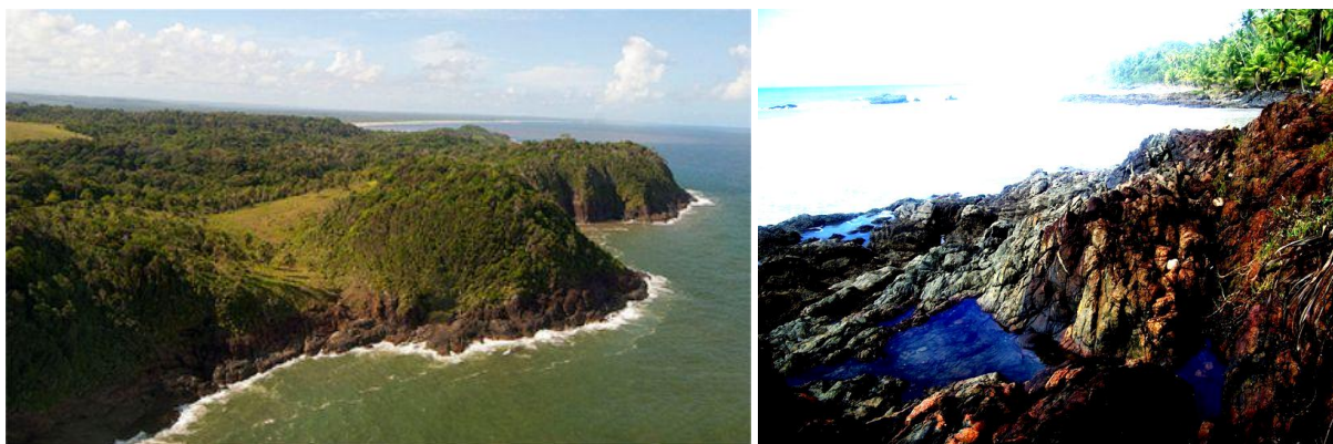
Figura 2. Outeiros cristalinos e cristalino-sedimentares na costa Sul de Itacaré. Fotografia: Frederico Rocha. Figura 3. Plataforma de abrasão marinha na praia do Havaizinho, costa Sul de Itacaré. Observar, em primeiro plano, o mergulho subvertical das foliações e fraturamentos transversais Fotografia: Ludmila Girardi Alves.

Composto por granulitos, pegmatitos e milonitos, entre outras rochas, o embasamento faz parte de um domínio metamórfico complexo, apenas parcialmente recoberto por rochas sedimentares (Formação Barreiras?) e depósitos quaternários (MELIANI, 2003). Sobre este substrato cristalino, por vezes, cristalino-sedimentar, os interflúvios correspondem a outeiros e morros com topos abaulados ou aplainados e vertentes convexas e convexo-côncavas (figuras 2). No contato com o mar, os afloramentos do embasamento cristalino configuram-se em costões rochosos esculpidos pelas ondas sob a forma de plataformas de abrasão e escarpas de erosão. De acordo com Meliani e Carvalho (2002), as características metamórficas e estruturais das rochas que afloram em Itacaré, mormente o mergulho sub-vertical das foliações e dos fraturamentos transversais, condicionam a formação de plataformas de abrasão que são comuns aos costões rochosos da costa Sul do município (Figura 3).