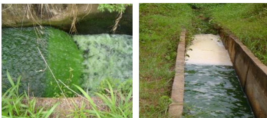
Figura 02- Despejo do efluente “tratado” das lagoas.

Em outro estudo realizado por (SATELLES, 2011), os resultados obtidos confirmam o impacto do lançamento do efluente sobre o Igarapé Grande que não possui capacidade de assimilação, em especial nos períodos de seca, dos nutrientes e espécies contaminantes durante o percurso até a sua foz no Rio Branco. A análise dos dados obtidos em sua amplitude ambiental mostra a necessidade de implementação de ações conjuntas para reversão dos danos ambientais causados ao Igarapé Grande e sua biodiversidade. Existe uma grande proliferação de algas no interior das lagoas, sendo que o efluente final possui uma coloração esverdeada que pode alterar as características naturais do corpo receptor o que verificou-se que realmente acontece (figura 02).