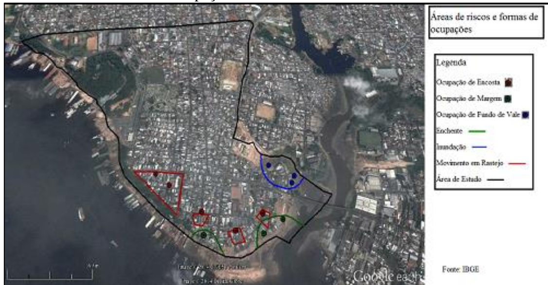
Áreas de risco e Formas de Ocupações no Bairro Raimundo.