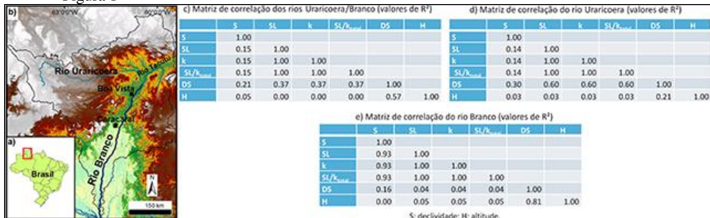
Figura 1. Mapa de localização e matrizes de correlação para: c) o conjunto Uraricoera/Branco; d) trecho do rio Uraricoera; e) rio Branco.