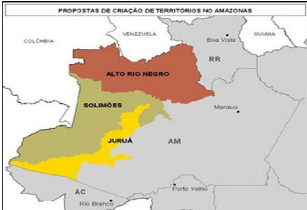
Figura 01 – Propostas de criação de territórios no Amazonas.

transporte aéreo, que necessita de grandes investimentos e infraestrutura tendo grande importância para incorporação ao restante do território.