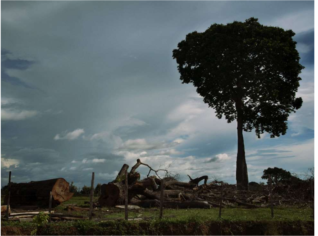
As castanheiras (A castanheira). Parintins- AM