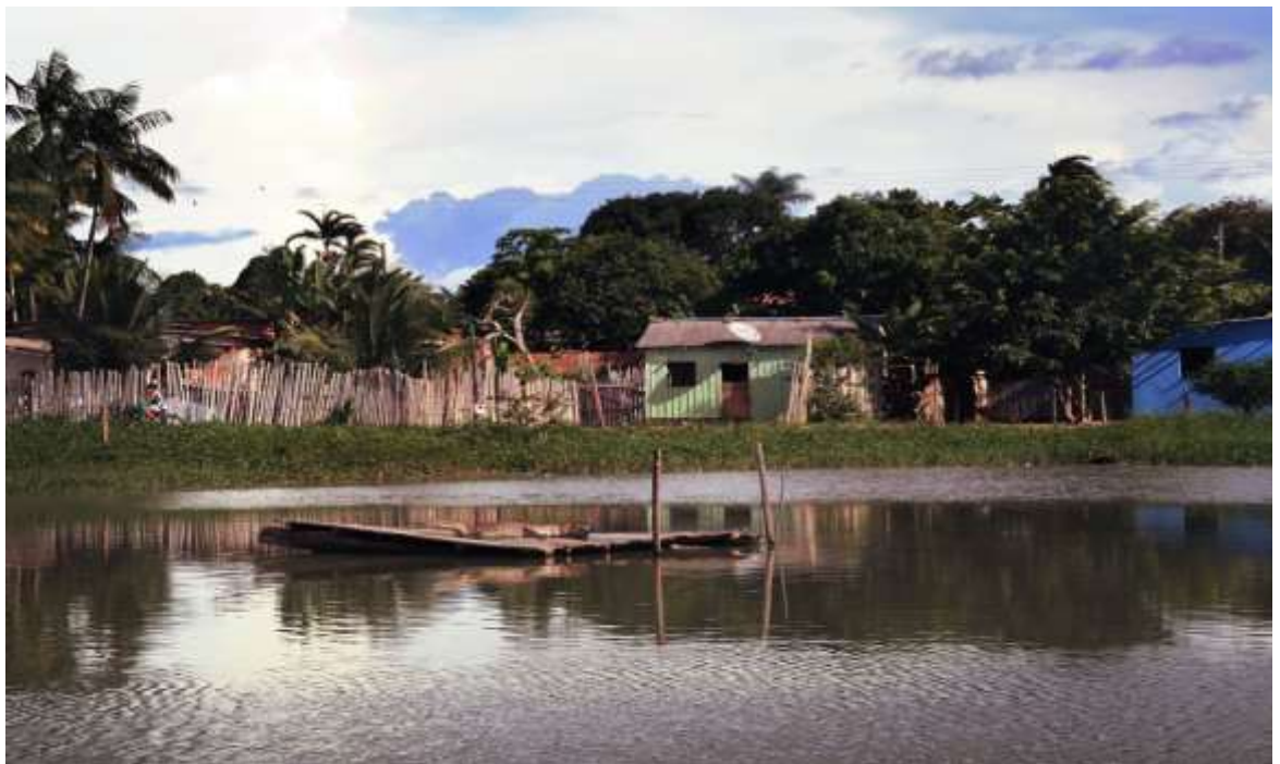
Lagoa do Bairro Paulo Corrêa. Parintins - AM