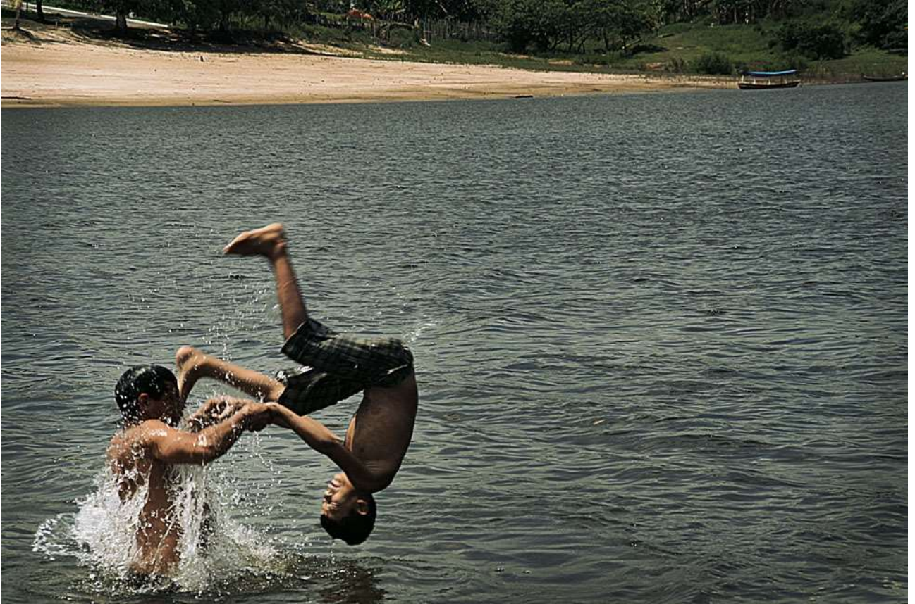
Meninos pulando n'água. Parintins - AM