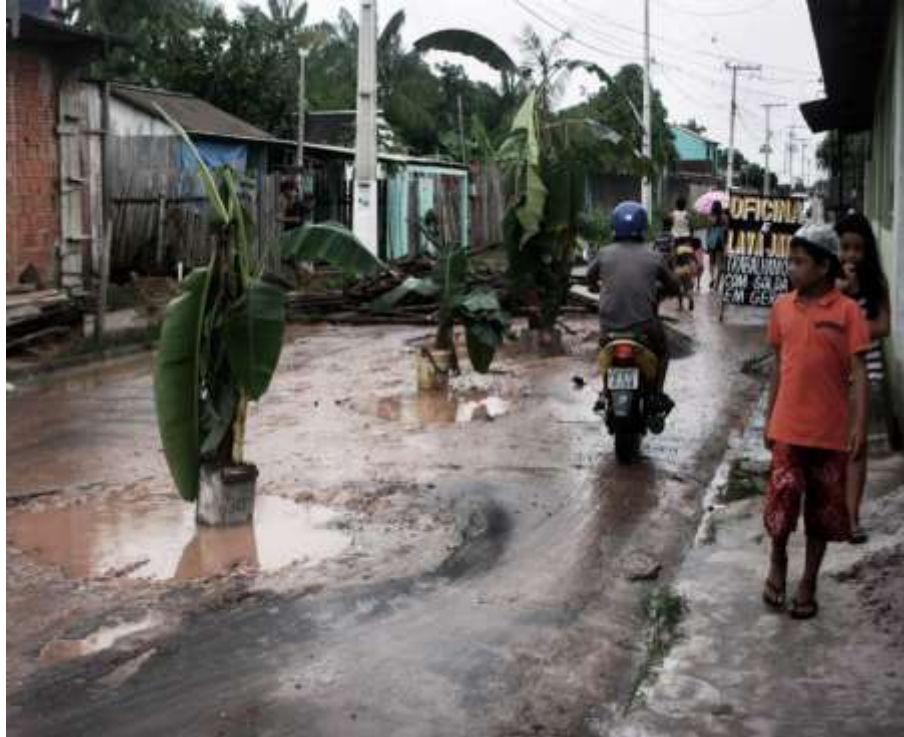
Protesto em rua de Parintins - AM