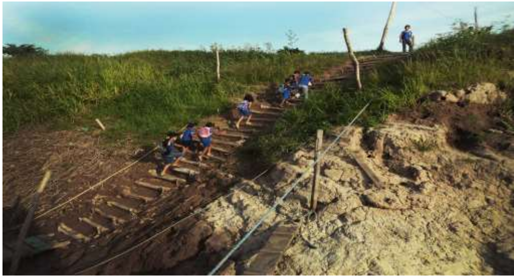
A escadaria. Parintins - AM