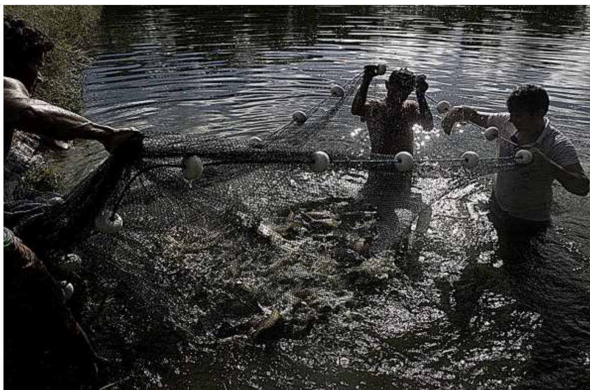
Cardume de Peixe. Parintins - AM