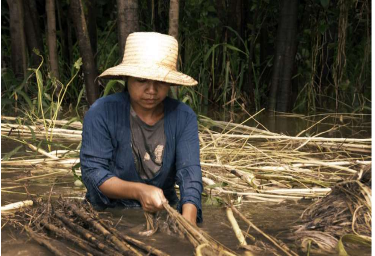
Juteira da Amazônia. Parintins - AM