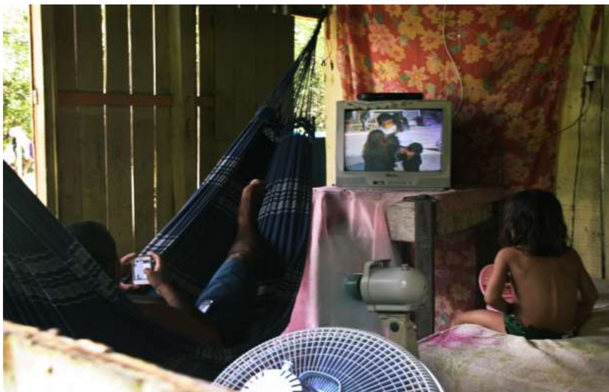
A tecnologia no cotidiano caboclo. Nhamundá- AM