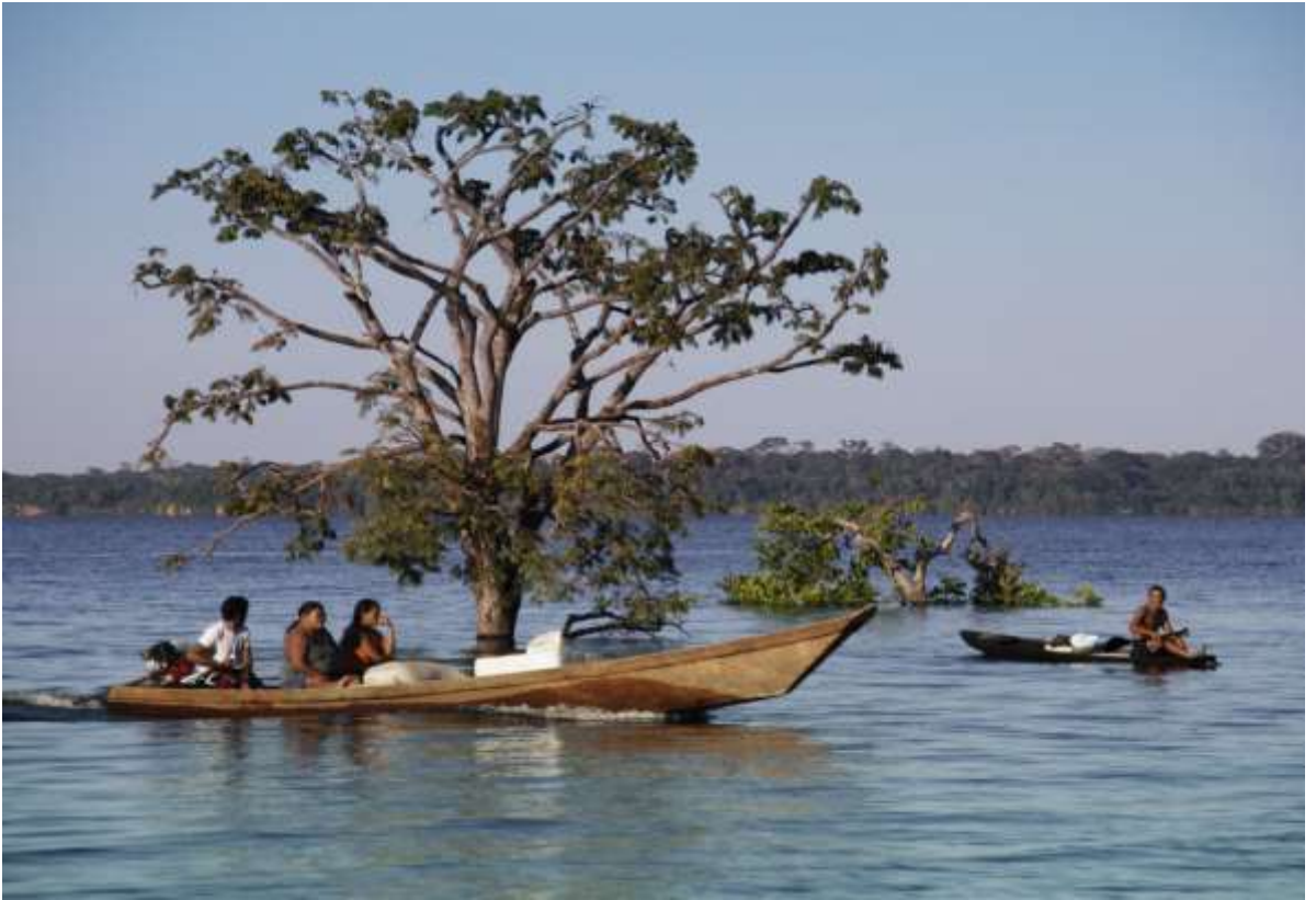
Transporte na Amazônia. Parintins - AM