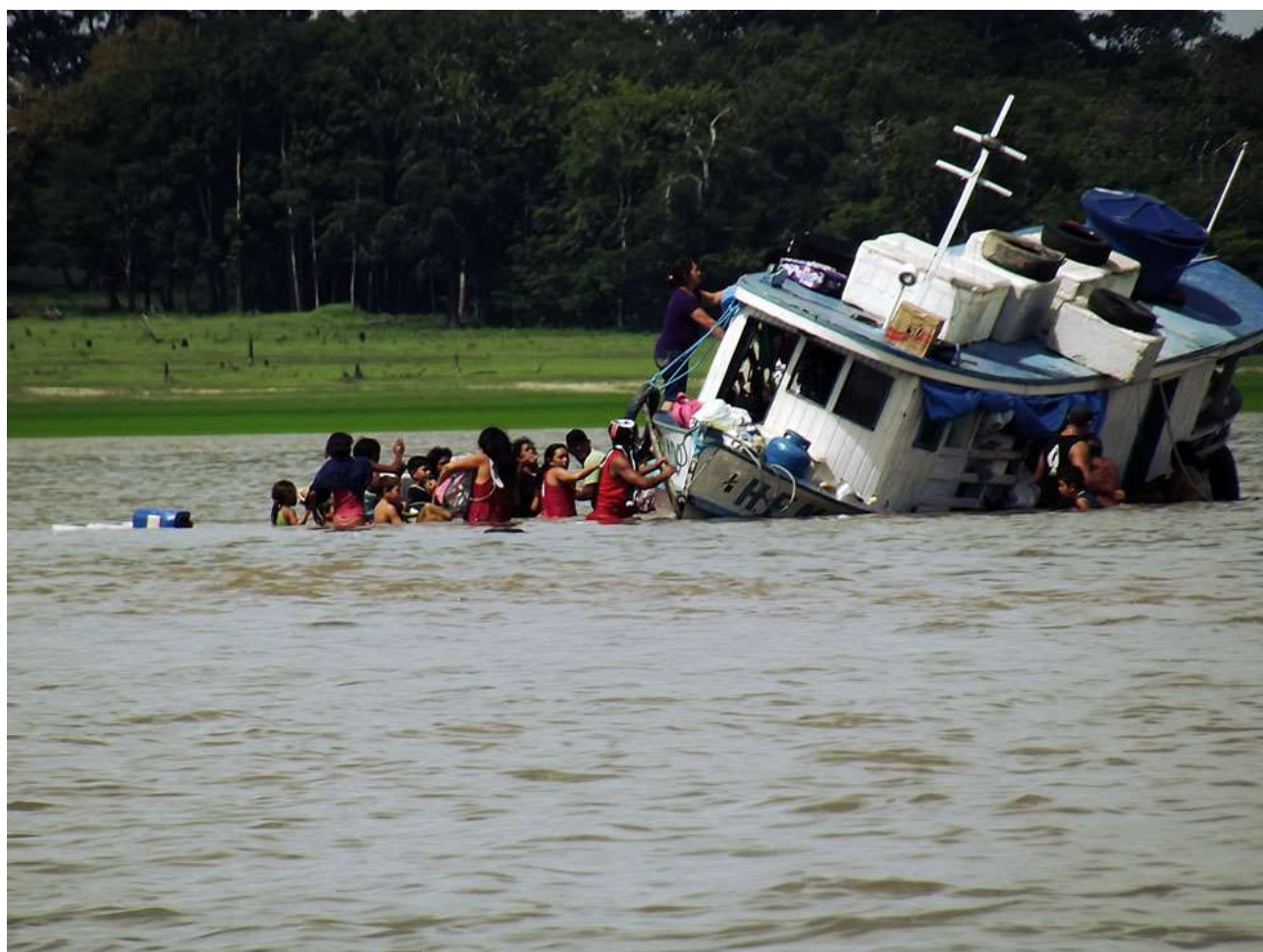
O naufrago. Santarém - PA