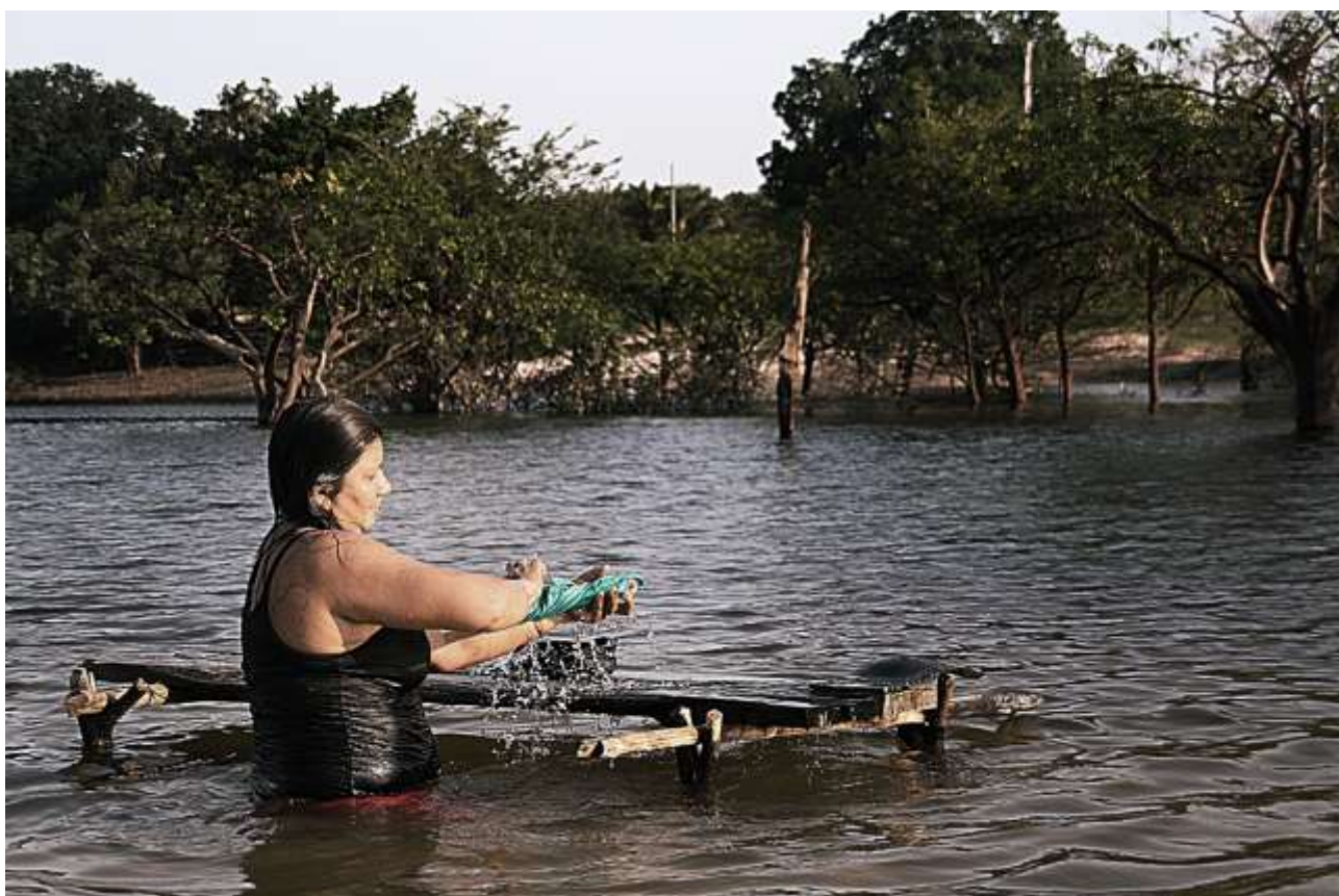
A lavadeira. Parintins - AM