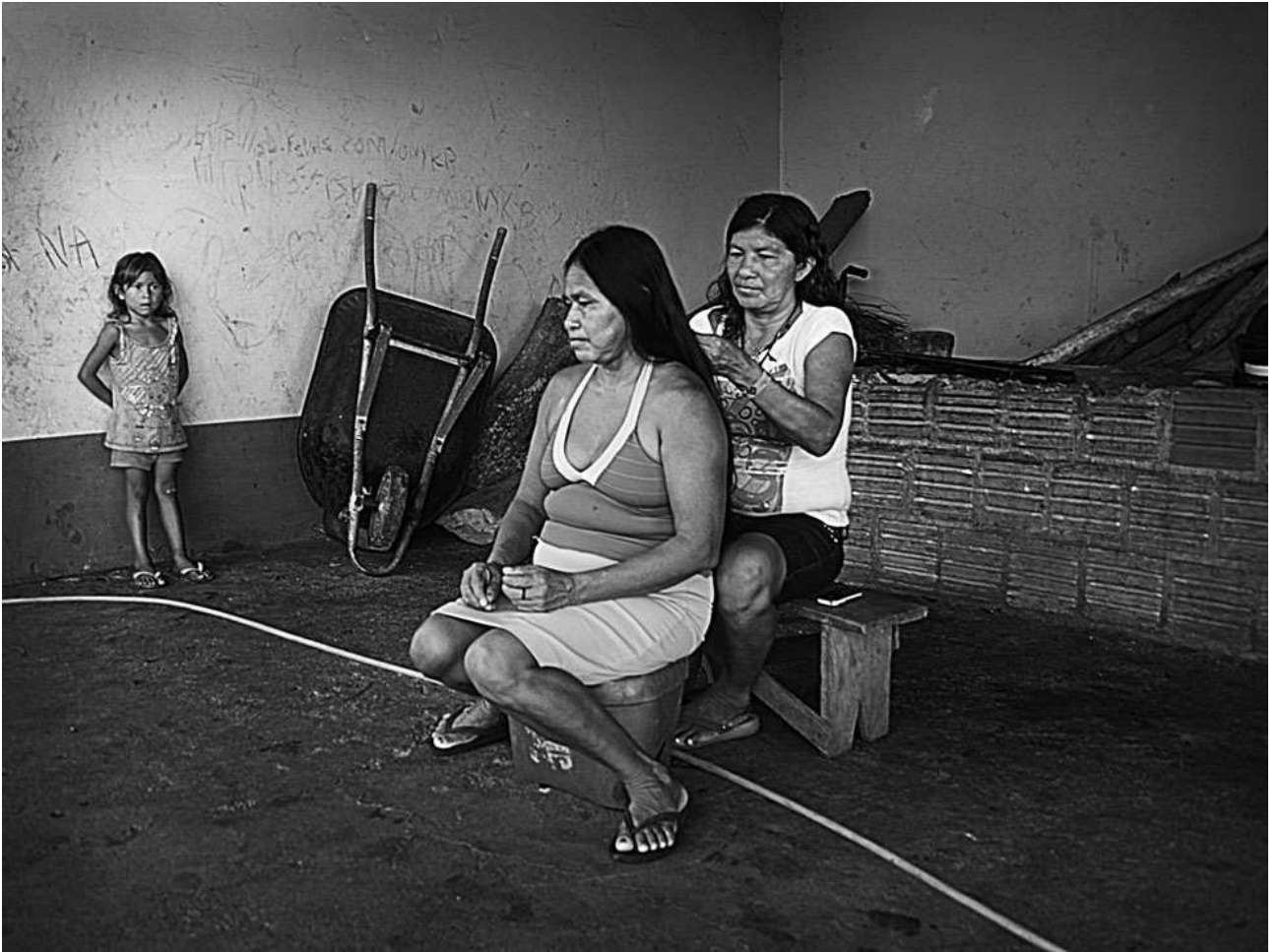
A origem. Parintins - AM