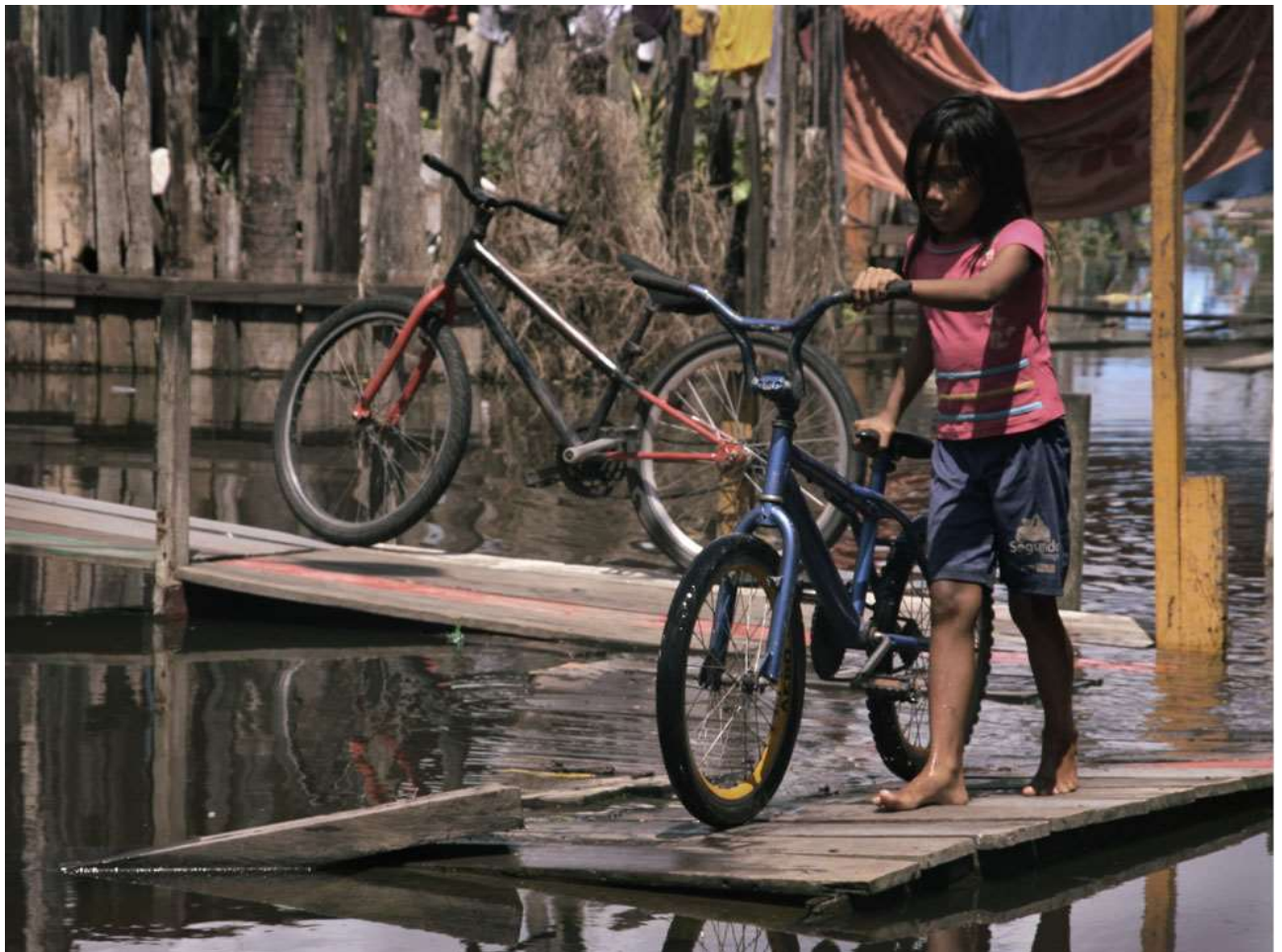
O passeio. Parintins - AM