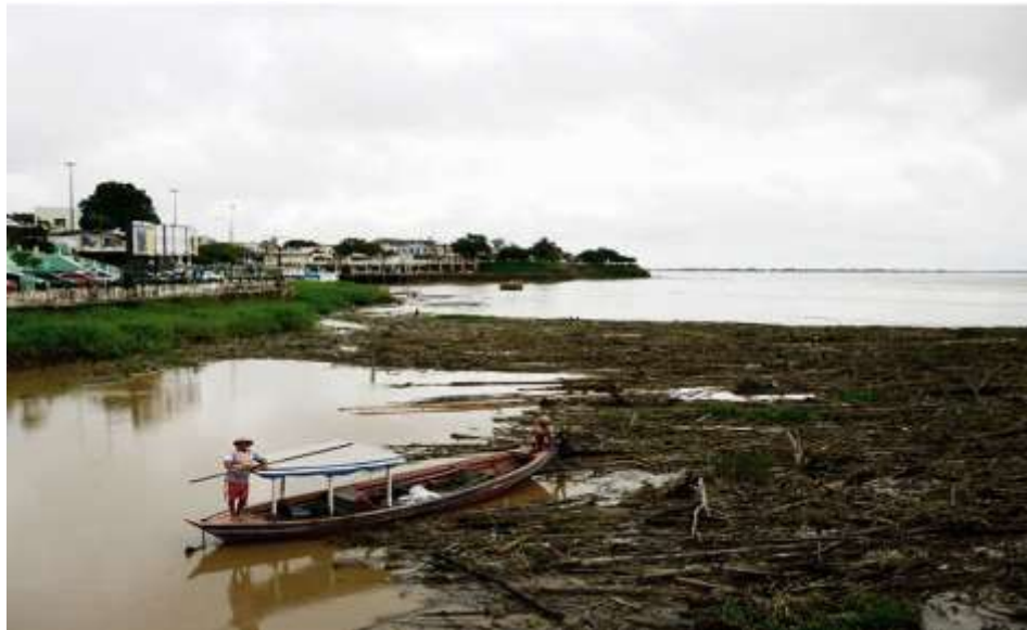
Cais dos troncos. Parintins - AM