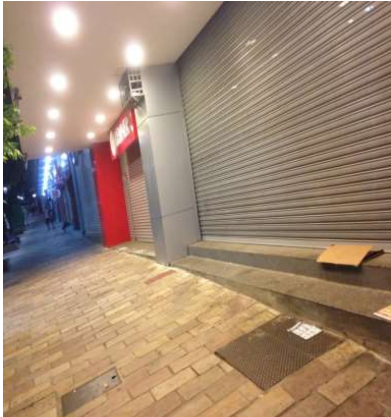
Figura 18. TEMA: DESCANSO. Cama preparada para o sono; Av. Eduardo Ribeiro, Centro de Manaus.