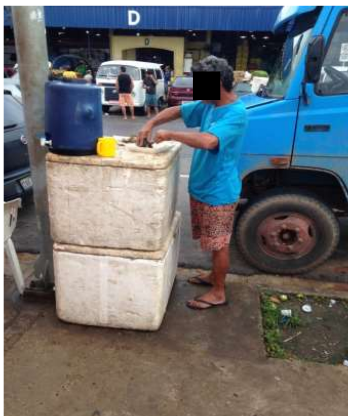
Figura 7. TEMA: COMIDA. Hora do almoço, Centro de Manaus.