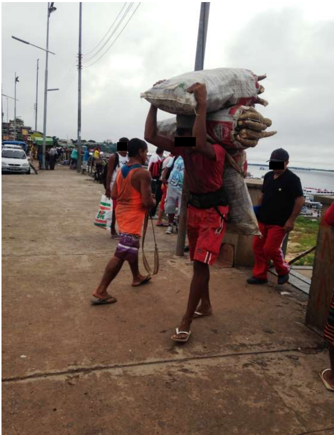
Figura 1. TEMA: TRABALHO. O trabalho no porto. Descarregando sacos de macaxeira.