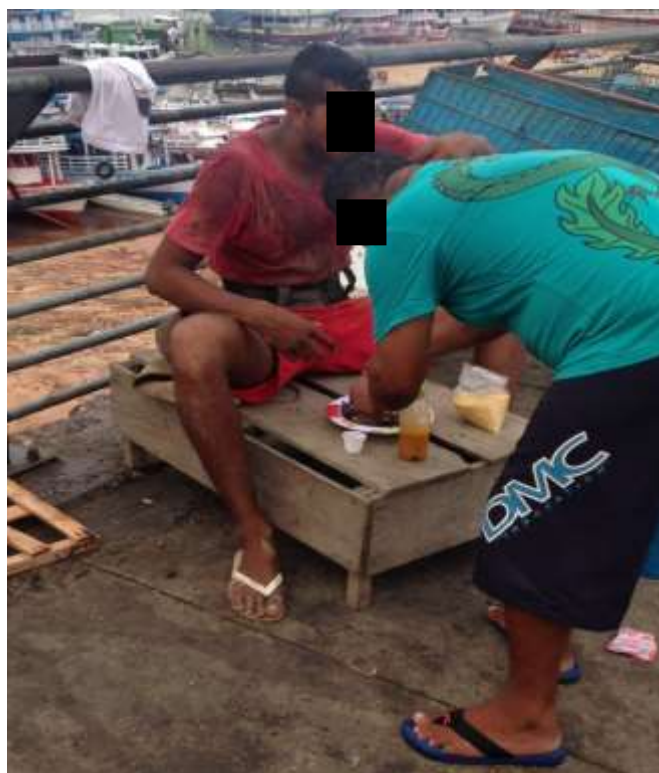
Figura 8. TEMA: COMIDA. Bodó, farinha, pimenta e tucupi. Orla de Manaus. Fonte: Noélio Martins Costa, 2016.