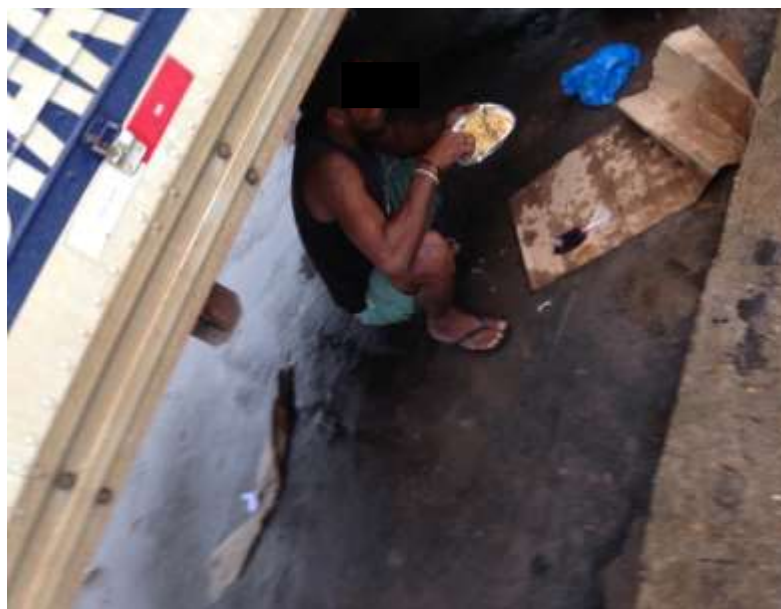
Figura 13. TEMA: COMIDA. Em qualquer lugar se come. Av. Manaus Moderna, centro de Manaus.