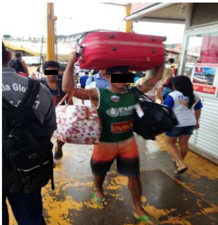
Figura 2. TEMA: TRABALHO. Balsa Amarela. Carregador de bagagens.