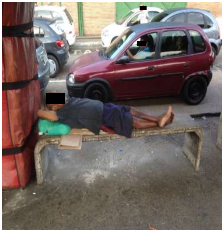
Figura 14. TEMA: DESCANSO. Descansar em meio ao movimento do centro de Manaus.