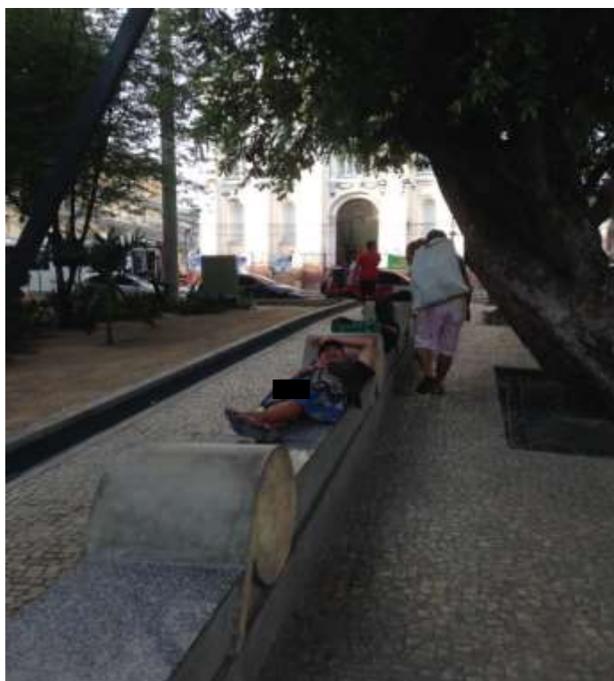
Figura 15. TEMA: DESCANSO. Trabalho pesado, descanso merecido. Praça dos Remédios, Centro de Manaus. Fonte: Noélio Martins Costa, 2016.