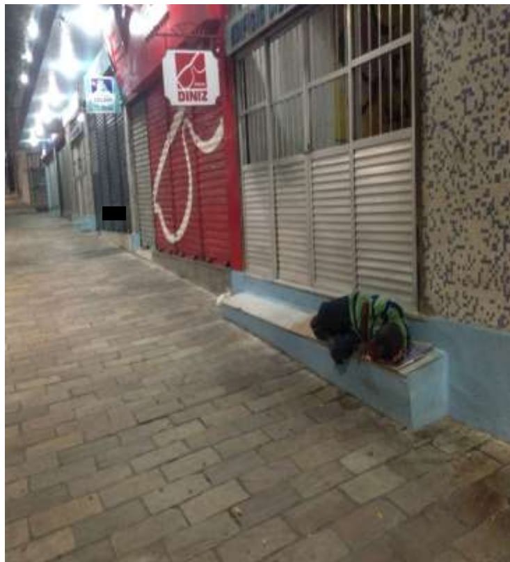
Figura 17. TEMA: DESCANSO. Repouso merecido depois de um dia “ralando”; Av. Eduardo Ribeiro, Centro de Manaus.