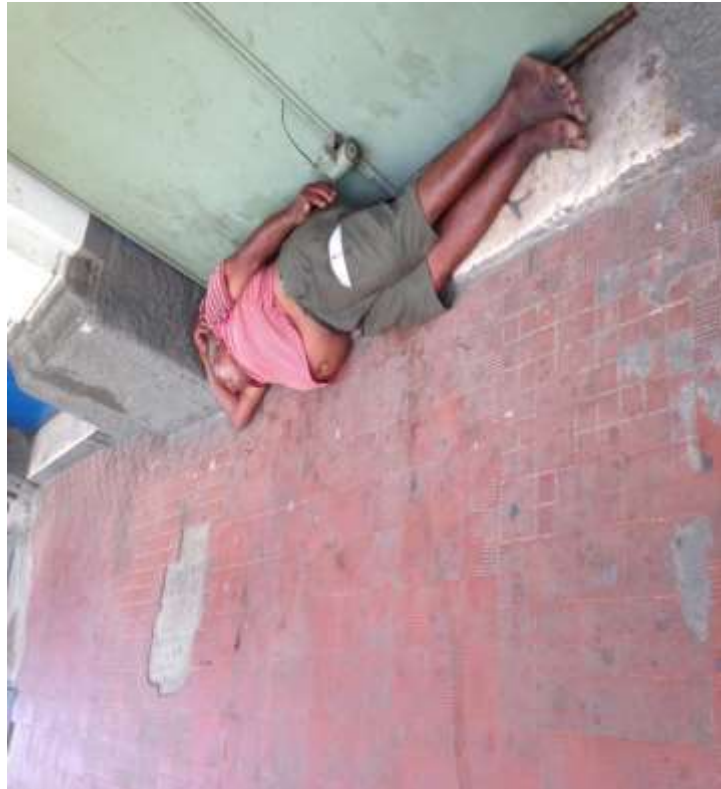
Figura 16. TEMA: DESCANSO. Calçada como cama; Feira da Manaus Moderna, Centro de Manaus.