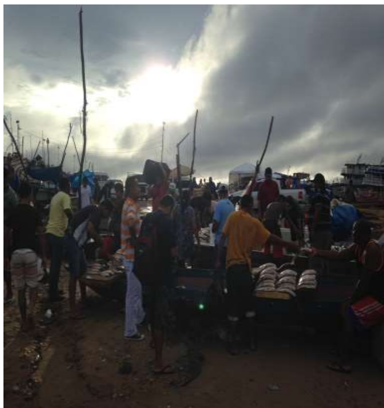
Figura 5. TEMA: TRABALHO. Venda de peixe na beira do Rio Negro.