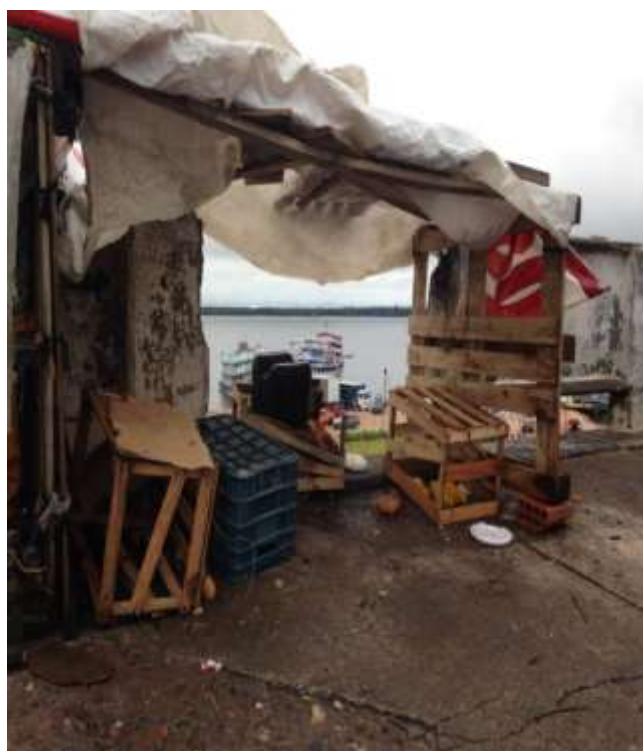
Figura 21. TEMA: DESCANSO. Um abrigo com vista para o Rio Negro; Orla do Rio Negro, Centro de Manaus.