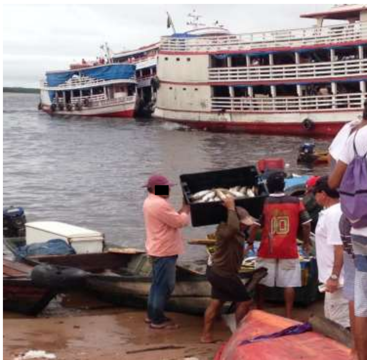
Figura 4. TEMA: TRABALHO. Descarregando peixe na orla do Rio Negro.