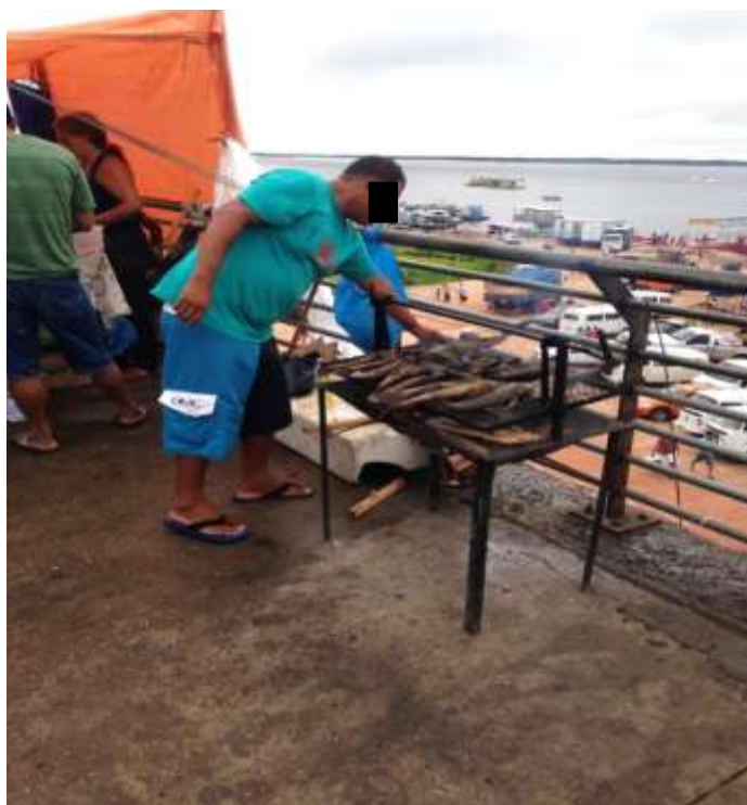
Figura 6. TEMA: COMIDA. Churrasco de bodó. Av. Manaus Moderna, Centro de Manaus. Fonte: Noélio Martins Costa, 2016.