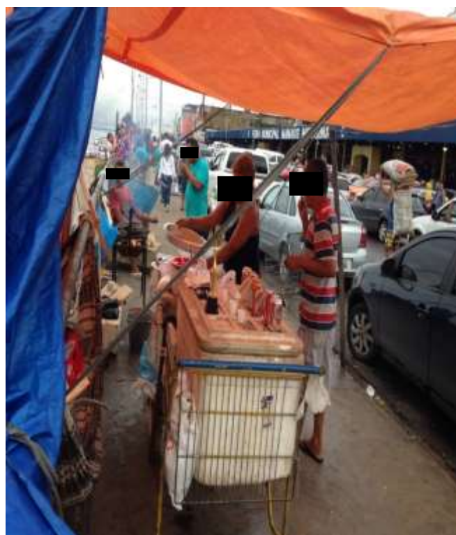
Figura 9. TEMA: COMIDA. Barraca de comida improvisada. Orla de Manaus.