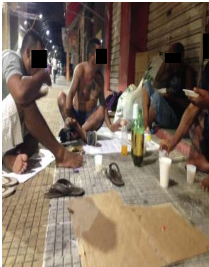
Figura 10. TEMA: COMIDA. Compartilhando alimentos. Rua Guilherme Moreira, centro de Manaus.