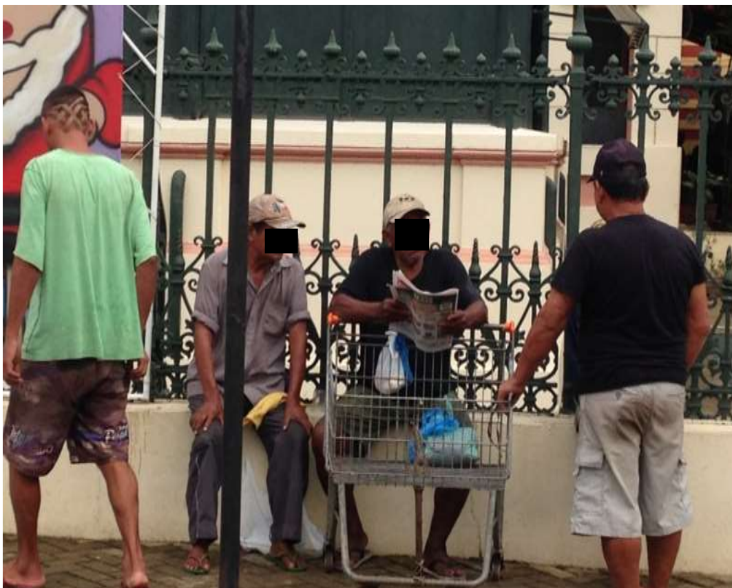
Figura 20. TEMA: DESCANSO. Hora da pausa para a leitura do jornal e conversa com os amigos; Av. Manaus Moderna, Centro de Manaus.