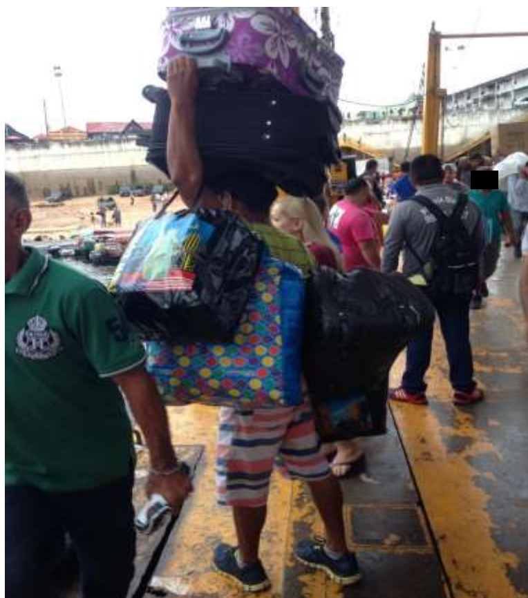
Figura 3. TEMA: TRABALHO. Balsa Amarela. Carregador sem limites de peso.