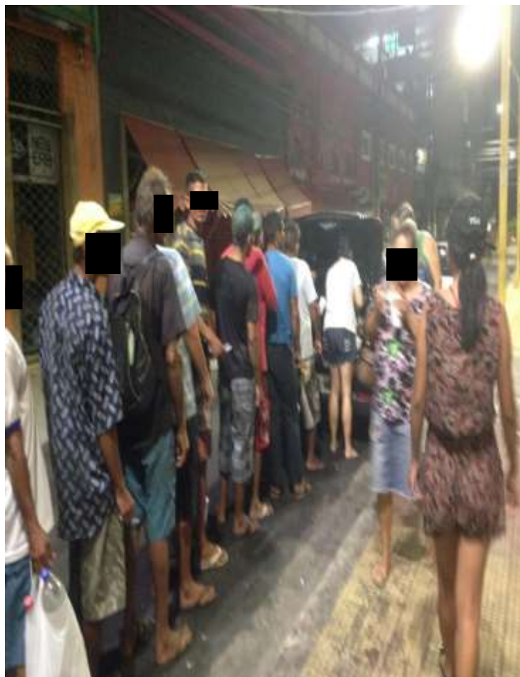
Figura 11. TEMA: COMIDA. Fila para a doação de alimentos para os moradores em situação de rua. Rua Guilherme Moreira, centro de Manaus.