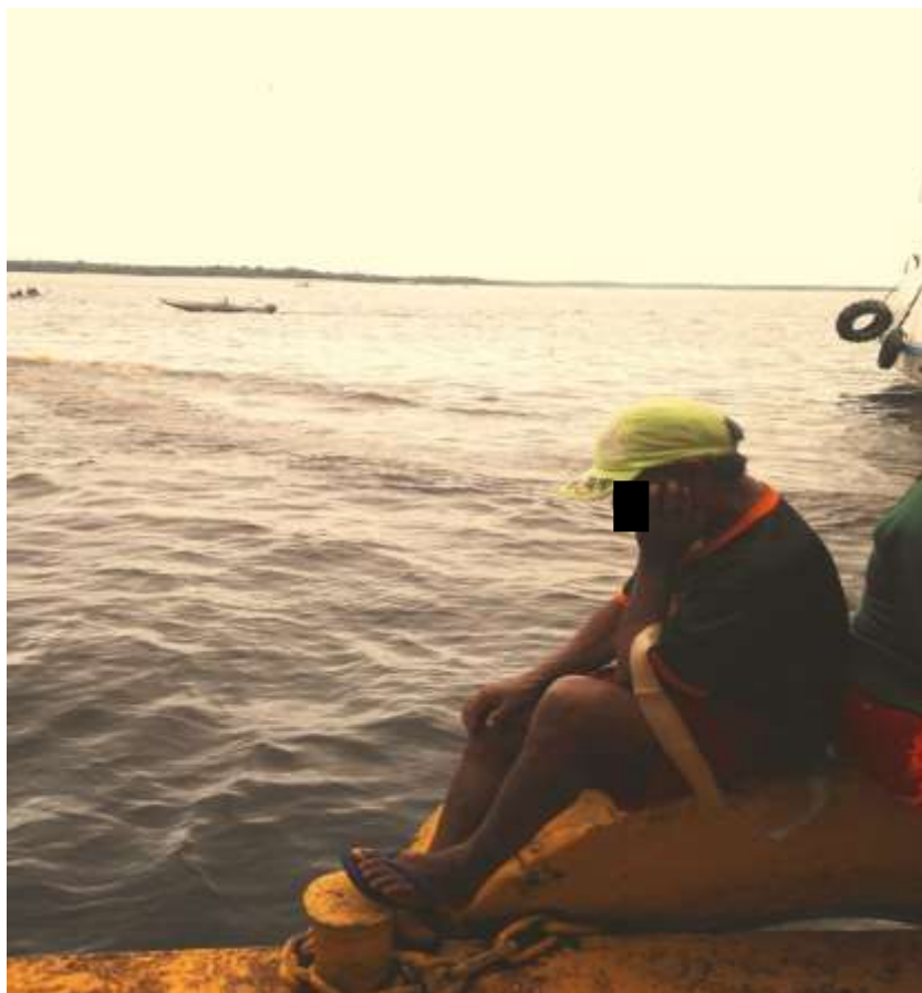
Figura 22. TEMA: DESCANSO. O pensador. Balsa Amarela, orla do Rio Negro, Centro de Manaus.