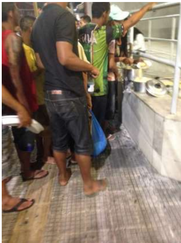
Figura 12. TEMA: COMIDA. Restaurante improvisado em frente à agência bancária. Rua Guilherme Moreira, centro de Manaus.