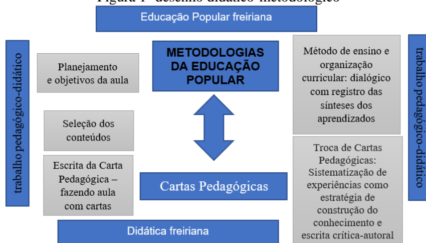
Figura 1- desenho didático-metodológico

Libâneo (2006, p.23) esclarece que a “tarefa de ensinar é uma modalidade de trabalho pedagógico e dele se ocupa a Didática.” E a “Didática é o principal ramo de estudos da Pedagogia. Ela investiga os fundamentos, condições e modos de realização da instrução e do ensino.” (LIBÂNEO, 2006, p.25). Concordamos com ele, quando afirma que o “trabalho pedagógico-didático [...] se expressa no planejamento do ensino, na formulação dos objetivos, na seleção dos conteúdos, no aprimoramento de métodos de ensino, na organização escolar, na avaliação” (LIBÂNEO, 2006, p.38), e ressaltamos que a didática freiriana é a nossa opção. A didática freiriana é uma dimensão do trabalho pedagógico do educador que escolhe a perspectiva da Educação Popular na sua prática educativa. E, sendo assim, a pedagogia do diálogo feito na e pela práxis pressupõe perguntas, curiosidade, problematização, ousadia e registro. O registro de uma experiência pressupõe refletir, estudar, pesquisar, analisar e pronunciar a nossa palavra. No meu caso, tenho usado as Cartas Pedagógicas como parte da pedagogia freiriana, cujo desenho metodológico representa a recuperação de minhas experiências educativas de fazer aula com Cartas Pedagógicas.