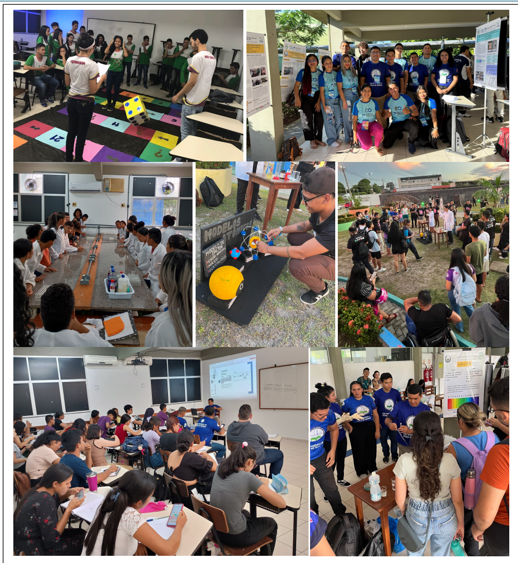
Figura 4: Atividades da LAEQ. A) Atividade lúdica. B) Apresentação em eventos científicos. C) Atividades experimentais. D) Divulgação científica. E) Experimentos na praça. F) Curso de nivelamento. G) Demonstração de experimentos

Na graduação, em muitos casos, o primeiro contato dos discentes com o público externo ocorre apenas durante os estágios supervisionados, nos últimos períodos do curso. Com a participação na LAEQ, estudantes dos períodos iniciais já podem vivenciar experiências docentes, recebendo alunos e conduzindo atividades didáticas. Isso reforça a indissociabilidade entre teoria e prática na formação de professores.