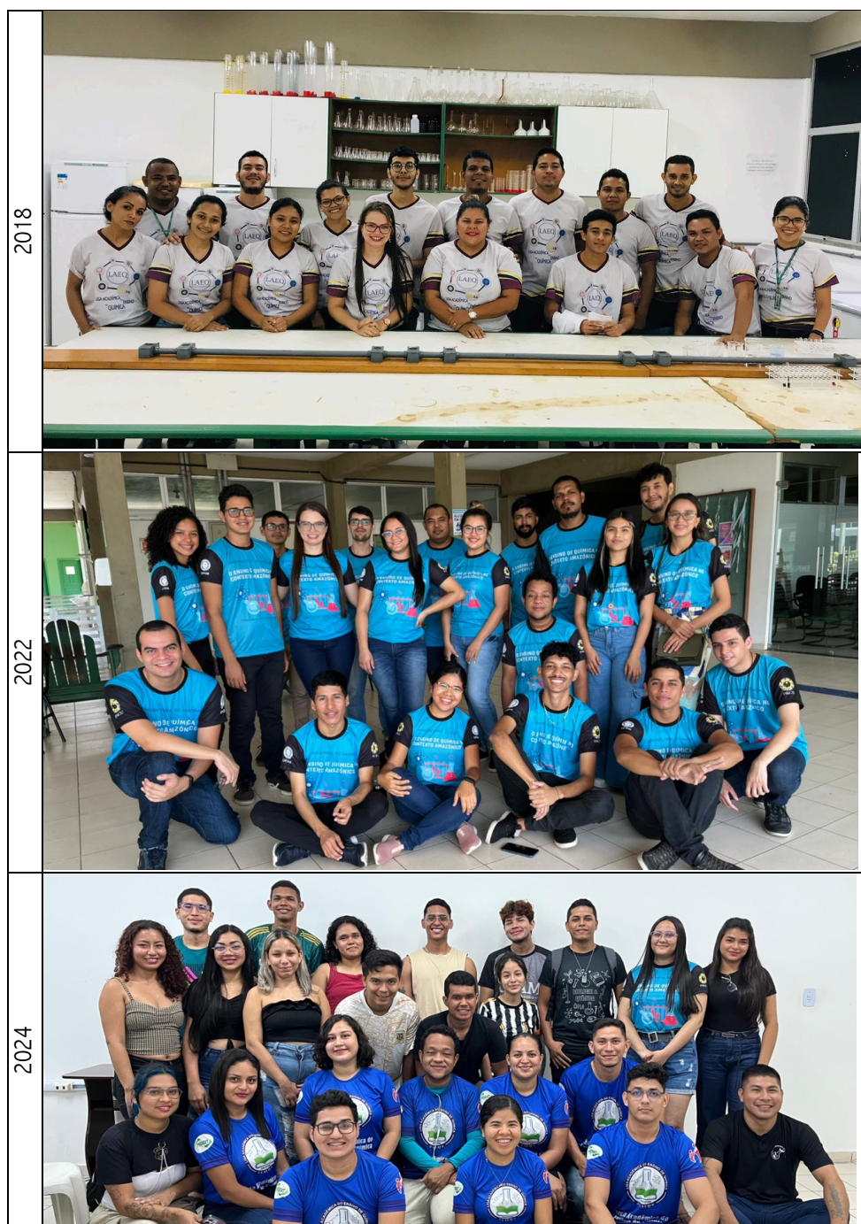
Figura 2: Registros dos participantes da LAEQ.

estudantil e de resistência frente às limitações estruturais comuns em universidades do interior amazônico.