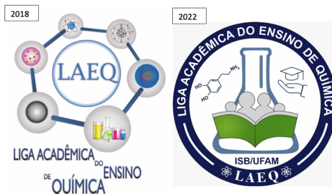
Figura 2: Registros do logo da LAEQ.

estudantes, mas também para o contexto em que estavam inseridos. Entre as atividades desenvolvidas, destacavam-se práticas didáticas como: apresentação de seminários, encontros para debater temas de maior dificuldade de aprendizagem, oficinas de exercícios sobre conteúdos considerados mais complexos e a realização de cursos de nivelamento para os estudantes ingressantes no ISB/UFAM.