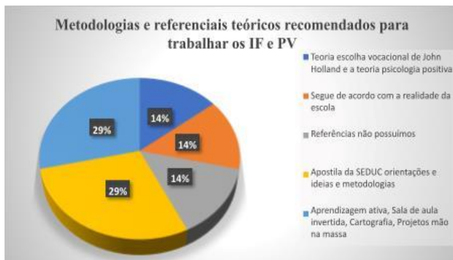
Gráfico 01: Recomendações para trabalhar com IF e PV