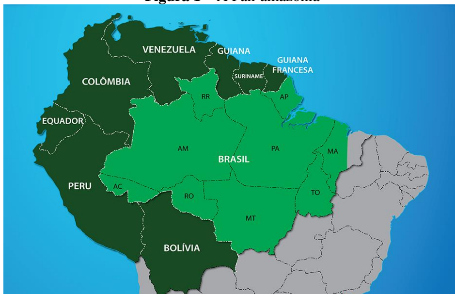
Figura 1 – A Pan-amazônia