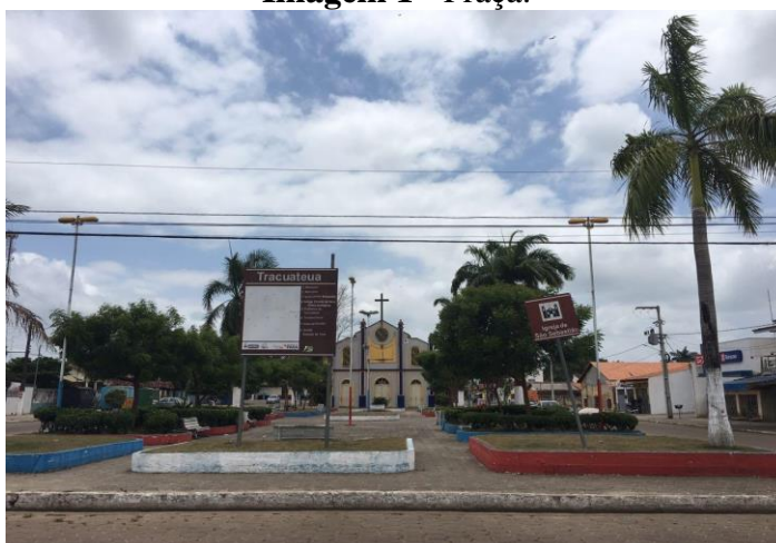
Imagem 1 - Praça.

É na praça que está a igreja onde são celebradas as missas da festividade e onde são fincados os mastros dos Santos que carregam donativos ofertados pelos juízes do festejo.