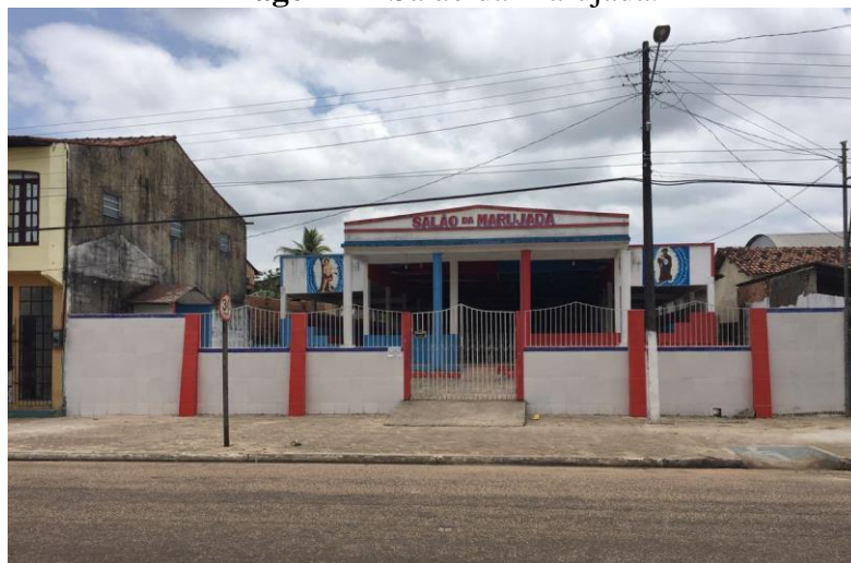
Imagem 2 - Salão da Marujada.

agradecimento, procissão e alimentação. Os bailados característicos da manifestação são executados no interior do espaço até à noite, por volta das vinte e duas horas.