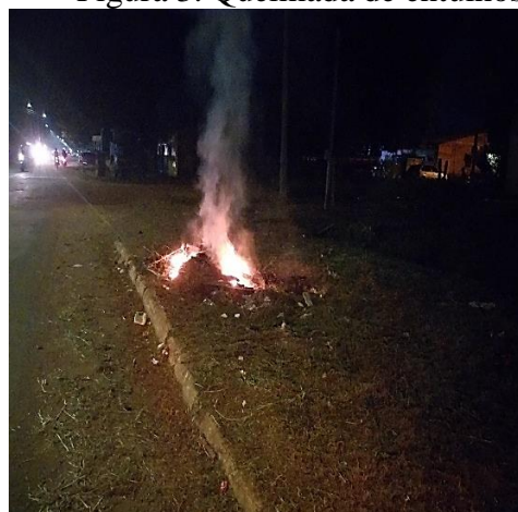
Figura 3. Queimada de entulhos

Como pode-se observar no gráfico acima, 70% dos moradores informaram que os entulhos devem ser queimados (Figura 3), a justificativa para a atitude está no fato de que o serviço de limpeza pública não recolhe todo tipo de objeto. Além disso, os moradores informaram que os móveis ou objetos descartados em grande parte já são reaproveitados ou não servem para nenhum tipo de reciclagem ou doação. Quanto ao descarte em caçambas, foi informado que estes tipos de trabalhos não são acessíveis para todos, pois não se trata de um serviço público.