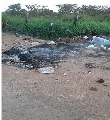
Figura 2. Descarte e queima de lixo em terreno baldio

Outro questionamento, foi quanto ao destino do lixo doméstico. Os moradores entrevistados afirmaram que o descarte do lixo é feito todos os dias, por meio do serviço de coleta pública. Porém, alguns moradores ainda indicaram que colocar fogo seria a melhor alternativa, esta prática é visualizada na figura 2.