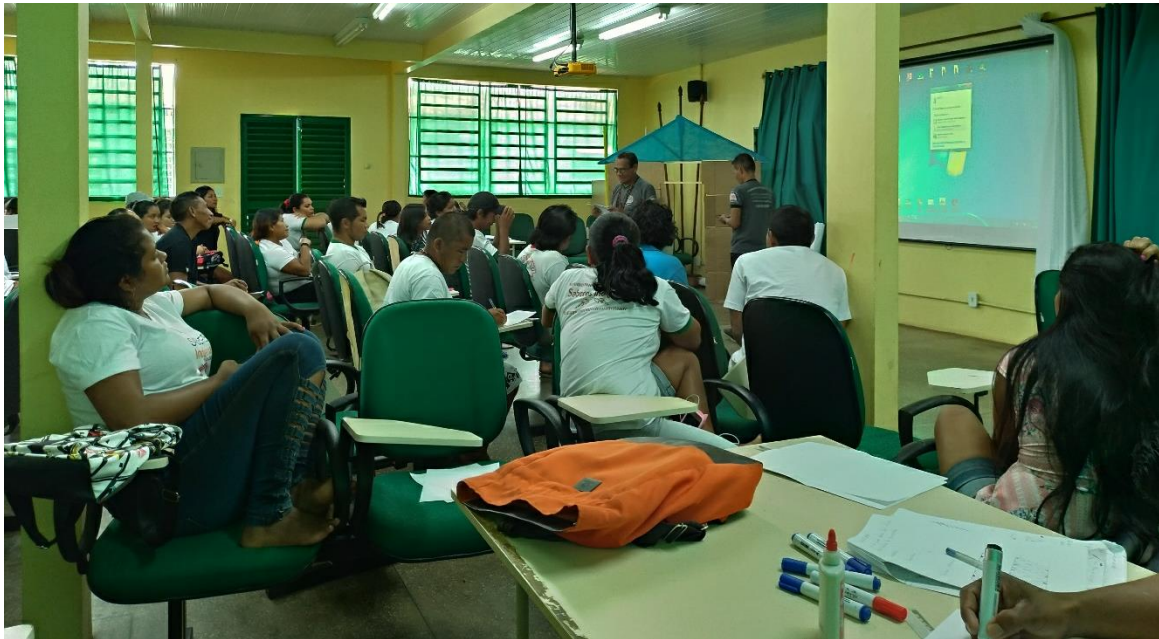
Figura 1 – Formação dos professores indígenas com os formadores locais, Lábrea-AM