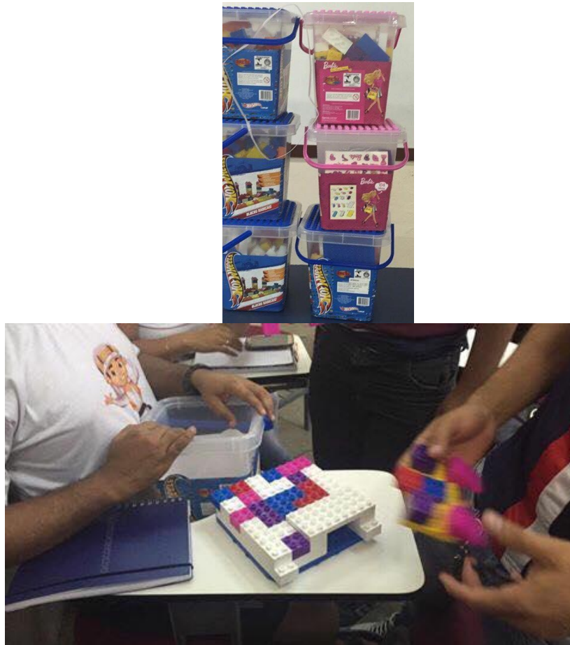
Figura 2 – Jogos de montagem Lego® utilizados em trabalhos de equipe na Universidade X.

Na Universidade X, de modo particular nas aulas de PCP, os jogos de montagem Lego® conseguem auxiliar no desenvolvimento de diversos aspectos, dentre os quais se destacam: trabalho em equipe, liderança, visão sistêmica e dinâmica de sistemas de produção, bem como tratamento do viés cognitivo, relacionamento das áreas das empresas, e o estímulo do espírito crítico nas decisões.