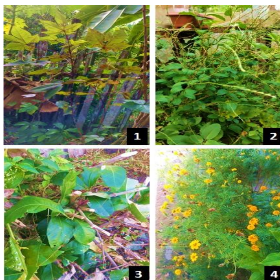
Figura 01: Algodão roxo ( Gossypium spp.); 2. Mucuracá ( Petiveria alliacea L.); 3. Alho-bravo ( Mansoa alliacea ); 4. Cravo ( Syzygium aromaticum ).

Mesmo que espécies tenham impregnado um papel importante na luta contra o coronavírus em forma de remédios caseiros e na mistura para a produção dos chás, sua eficácia e benefícios na prevenção contra a Covid-19, não é de fato verídica e satisfatória, pois está ligada ao uso popular e baseadas em ideias de cura não consideradas pela ciência. Além disso, não existem estudos científicos que comprovem a eficácia do uso destes vegetais e das demais (descritas posteriormente) na prevenção e tratamento dos sintomas da Covid-19. Logo, verificou-se espécies de plantas utilizadas pelos moradores (Figura 01).