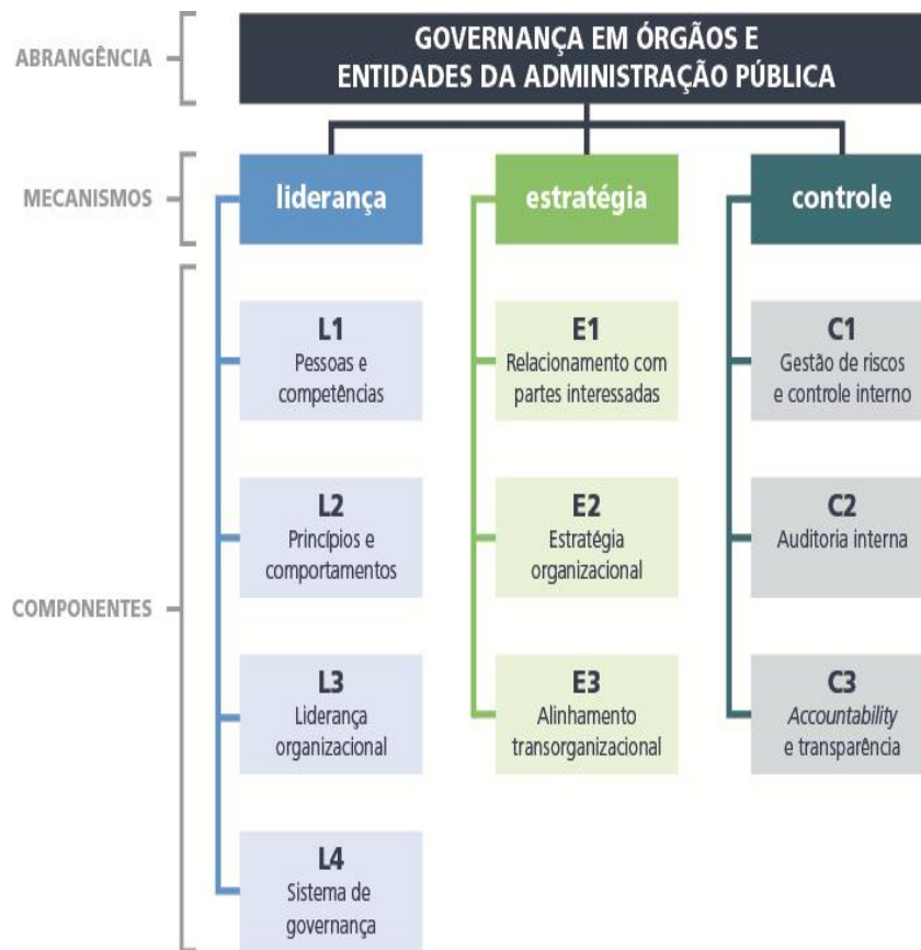
Figura 3: Mecanismos e Componentes de governança, é uma adaptação da tabela 1

Na Gestão de pessoas, o conjunto de práticas institucionais que visam a estimular a motivação para o desenvolvimento de competências e melhoria do desempenho e do comprometimento dos funcionários com a instituição, favorecendo o alcance dos objectivos institucionais. Neste processo são mobilizadas conhecimento (o que fazer), habilidades (como fazer) e atitudes (pré-disposição ou motivação de querer fazer) do funcionário, no contexto de trabalho individual ou em equipe, em prol do foco institucional. Enquanto que a gestão de desempenho surge como conceito alternativo às técnicas tradicionalmente utilizadas para a avaliação de desempenho. O termo gestão é conotado ao processo que envolve actividade de planificação, de acompanhamento e de avaliação (Denhardt & Denhardt, 1998). Este cenário, pressupõe como já nos referimos, que o gestor como alta instância apoio regularmente à governança na realização das actividades e finalmente, o sistema de governança deve ser definido e avaliado pela mais alta instância. Outrossim, pressupõe a definição de um limite de tempo para o que