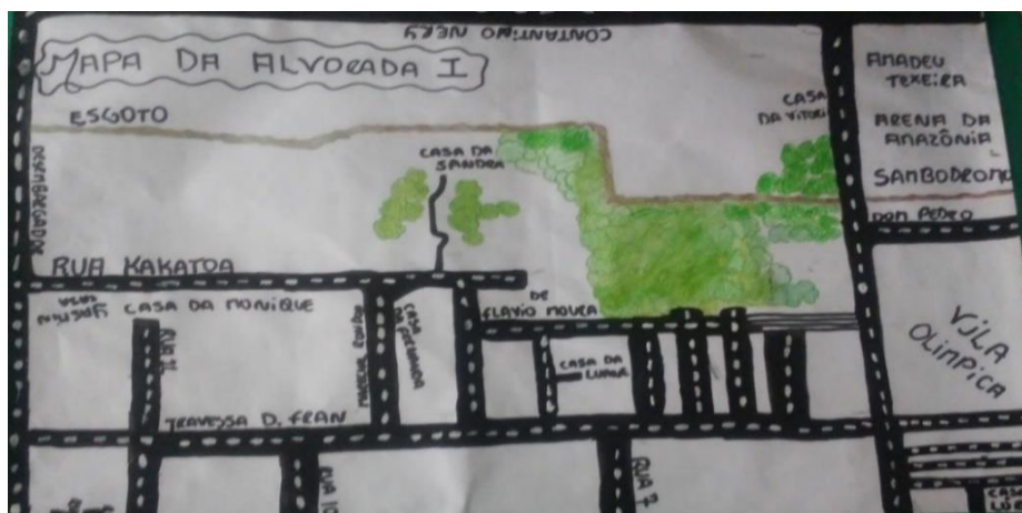
Figura 1 — Mapa mental dos problemas ambientais no bairro Alvorada I