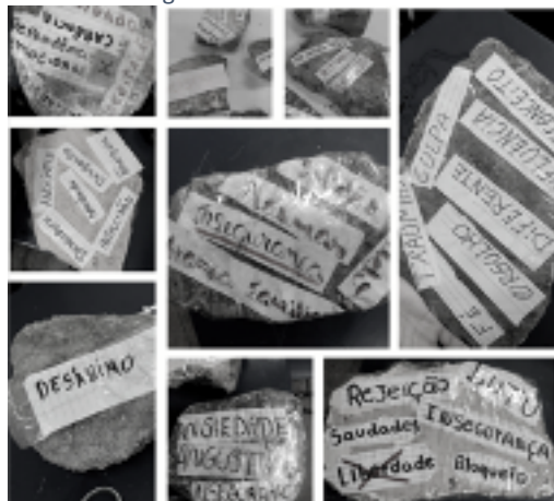
Figura 2 - Pedras com escritas

as melhores notas, que acaba sendo um gatilho para a ansiedade na vida de algumas das estudantes. Esses foram alguns dos temas trazidos por elas e explorados ao longo do nosso processo junto. Abaixo tratei alguns registros que nos ajudam a entender melhor a performance realizada.