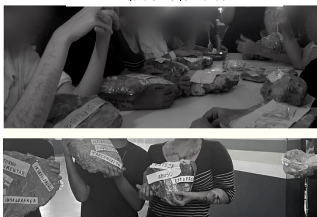
Figura 5: Performando.