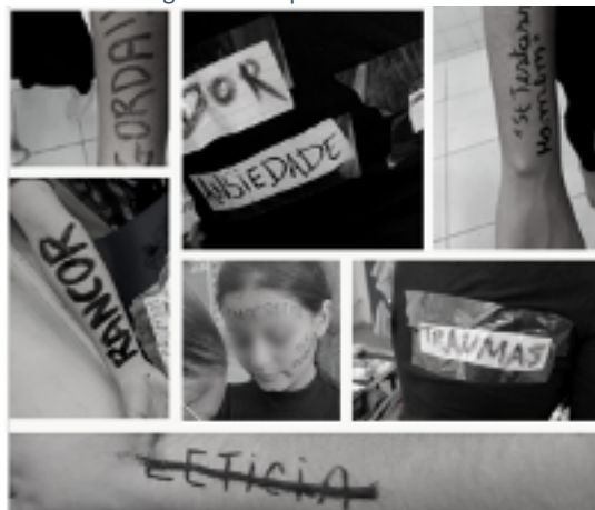
Figura 3 - Corpos com escritas