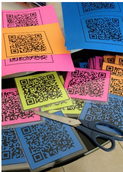
Figura 2 - QR Code impressos e plastificados