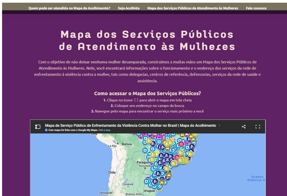
Figura 6. Quero ser acolhida - Mapa dos serviços - Mapa do Acolhimento