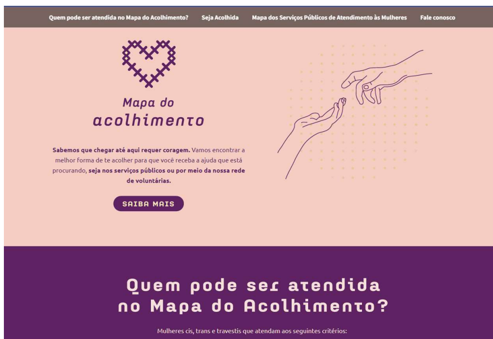
Figura 5 Quero ser acolhida - Mapa do Acolhimento

Ao clicarmos no botão "Preciso de Ajuda" ou na opção correspondente na barra de navegação, presente na página inicial, somos redirecionados para a página "Quero ser acolhida" (Figura 5). Esta página apresenta um texto que transmite uma mensagem de apoio e encorajamento para aquelas que estão buscando ajuda. O objetivo é garantir que a mulher se sinta bem-vinda e receba a assistência necessária. Essa página possui uma paleta de cor com os mesmos tons da página inicial, acrescentando-se o rosa. A tipografia sofre uma alteração para os títulos das seções.