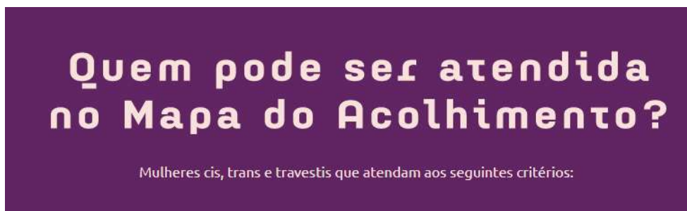
Figura 7. Quero ser acolhida - Tipografia - Mapa do Acolhimento

ilegível e o “t” que pode ser confundido com o “j”, item de especial atenção na acessibilidade tipográfica (LUPTON, 2012).