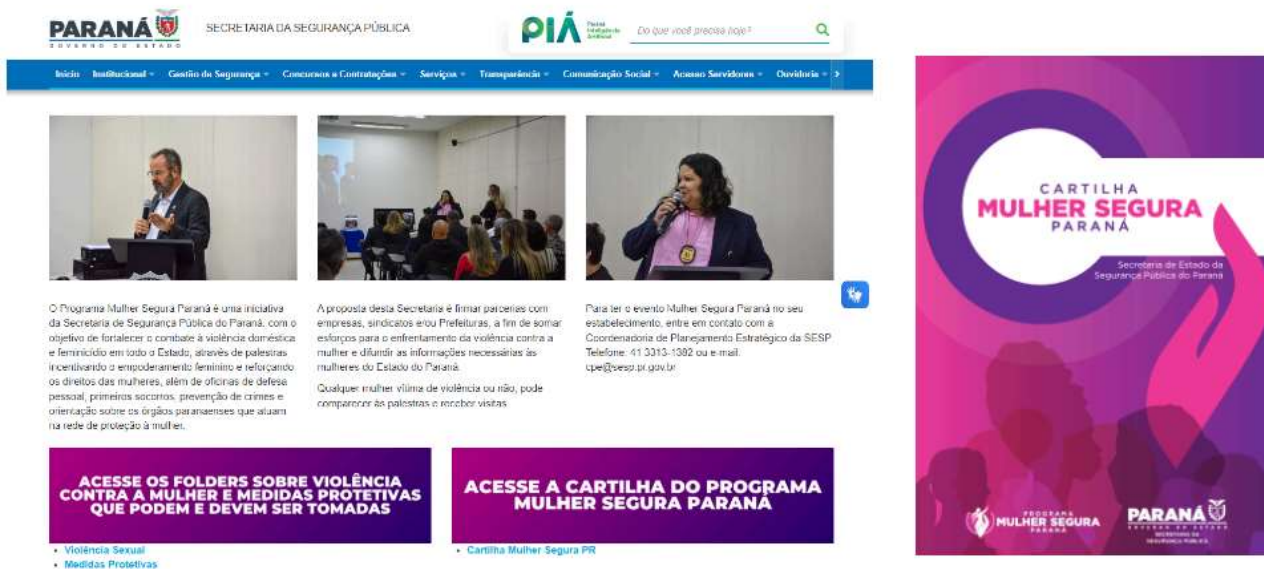
Figura 3. Página do Programa Mulher Segura Paraná e Capa da Cartilha para download

cartilha, nos meios de comunicação digitais. Em outras palavras, do ponto de vista digital, a disseminação da informação é ineficiente.