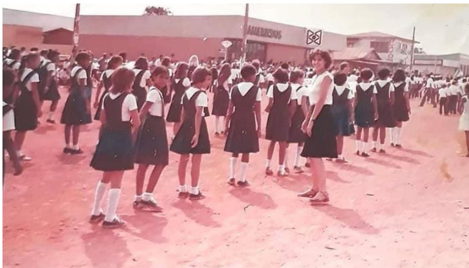
Figura 3 – Preparação das filas para desfile cívico, década de 1970

Desta forma, a importância para que estes rituais tomassem forma através dos atos cívicos, festas e comemorações onde fosse possível visualizar os feitos de grandes heróis constituía-se como formas de poder, para que a ordem social fosse mantida. E, a escola, neste cenário, era local propício para se cultivar os valores determinados pela elite que governava o país (ROHDEN, 2012, p. 85).