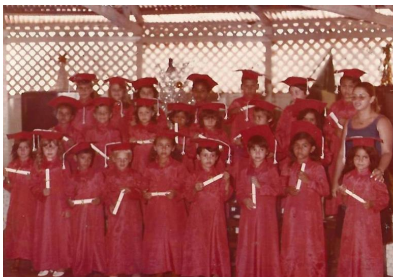
Figura 2 – Formatura da pré-escola, década de 1970

É possível identificar, no registro documental, a resolução que atende a solicitação de criação e autorização de funcionamento e reconhecimento de estabelecimentos de ensino pré-escolar com o chamado “jardim de infância”. Uma questão conflitante estava no quesito de formação profissional de professores que deveria estar em consonância com a categoria de titulação para a atuação com a pré-escola.