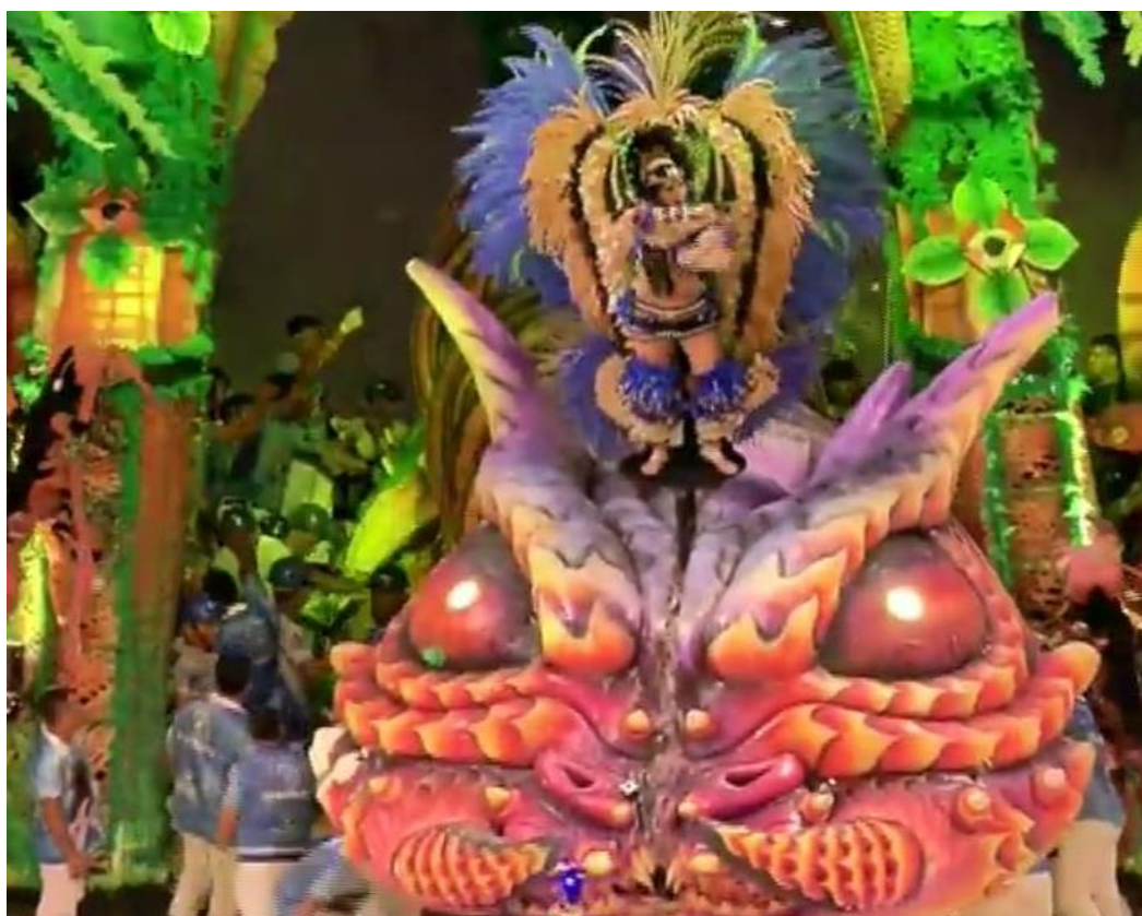
Figura 3: Aparição da cunhã-poranga Marcielle Albuquerque nas costas da lagarta-de-fogo, segunda noite. 2018.