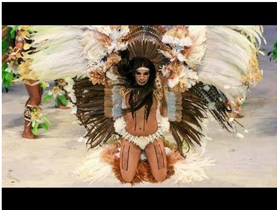
Figura 2: Cunhã-poranga do Boi Caprichoso, primeira noite. 2018.

Interessante o elo estabelecido entre Naruna e Ceucy, já que, segundo algumas versões da mitologia, a primeira seria descendente da segunda, mãe de Jurupary, tendo uma ligação consanguínea e sagrada (NAKANOME, 2018). Tanto Naruna quanto Ceucy adquirem, então, representatividade feminina dentro do universo mítico amazônico.