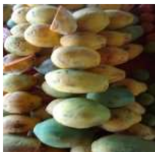
Foto 5