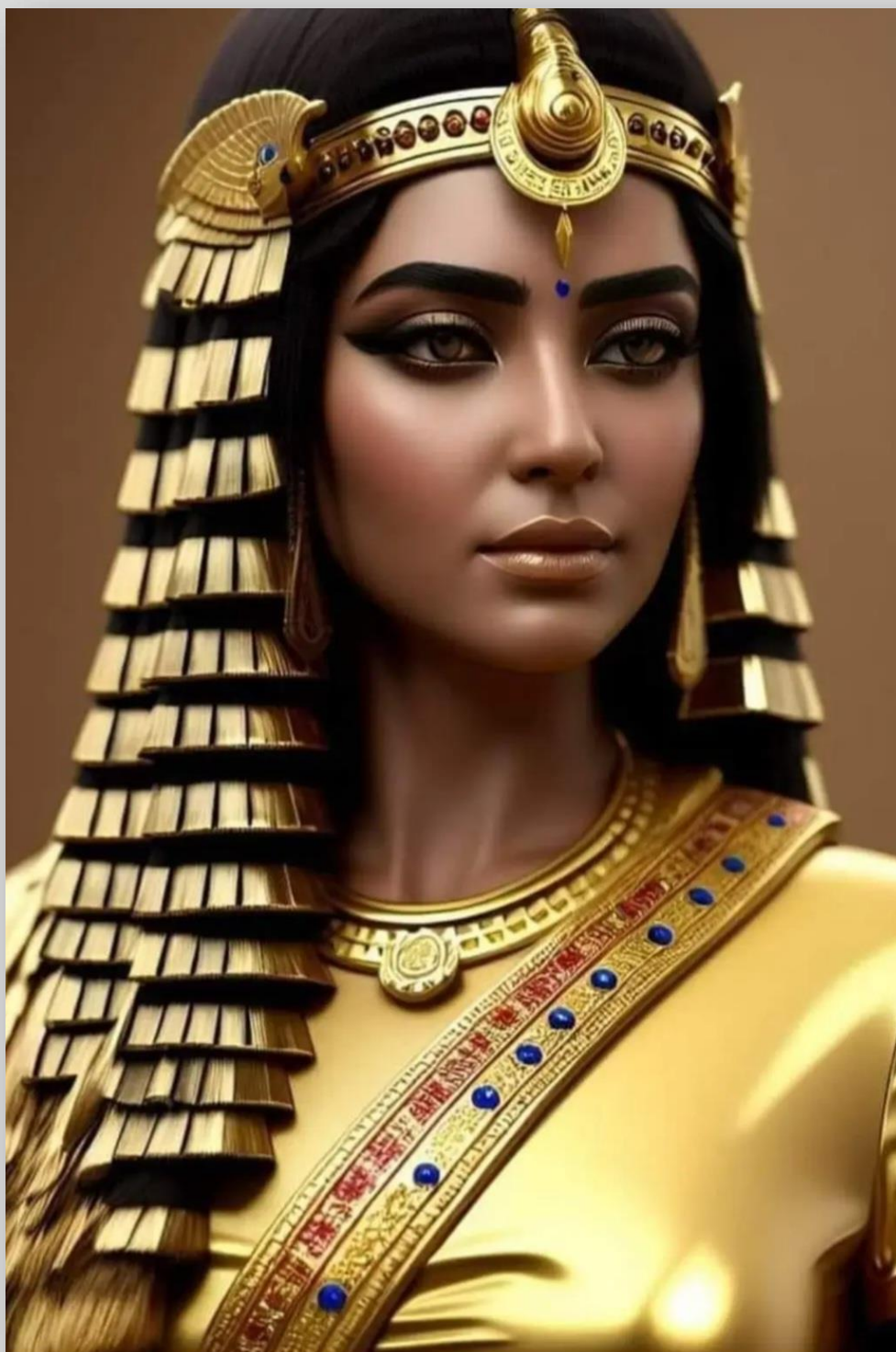
Figura 2: Faraó Cleópatra VII Thea Filopátor ((em grego clássico: Κλεοπάτρα Φιλοπάτωρ).