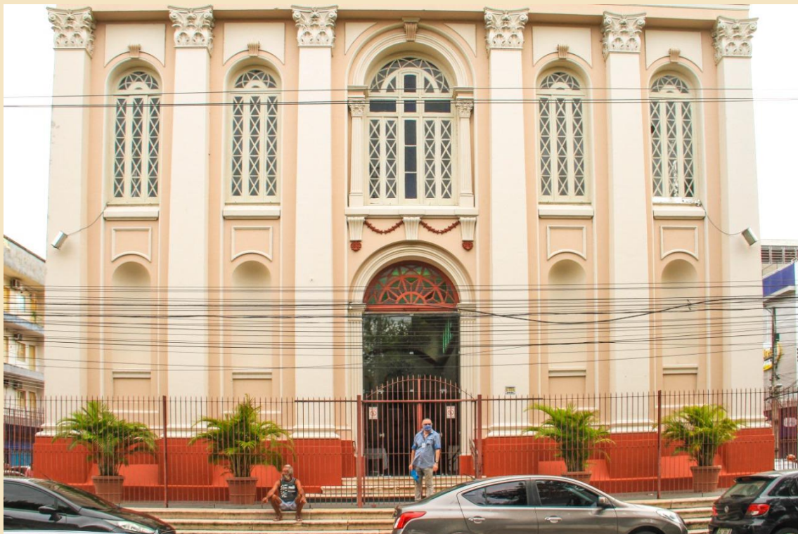
Figura 3: Igreja Nossa Senhora dos Remédios. Localizada: Rua Leovegildo Coelho, 237 no Centro em Manaus - Amazonas.

Os artigos escolhidos para o mês de novembro de 2021 são: