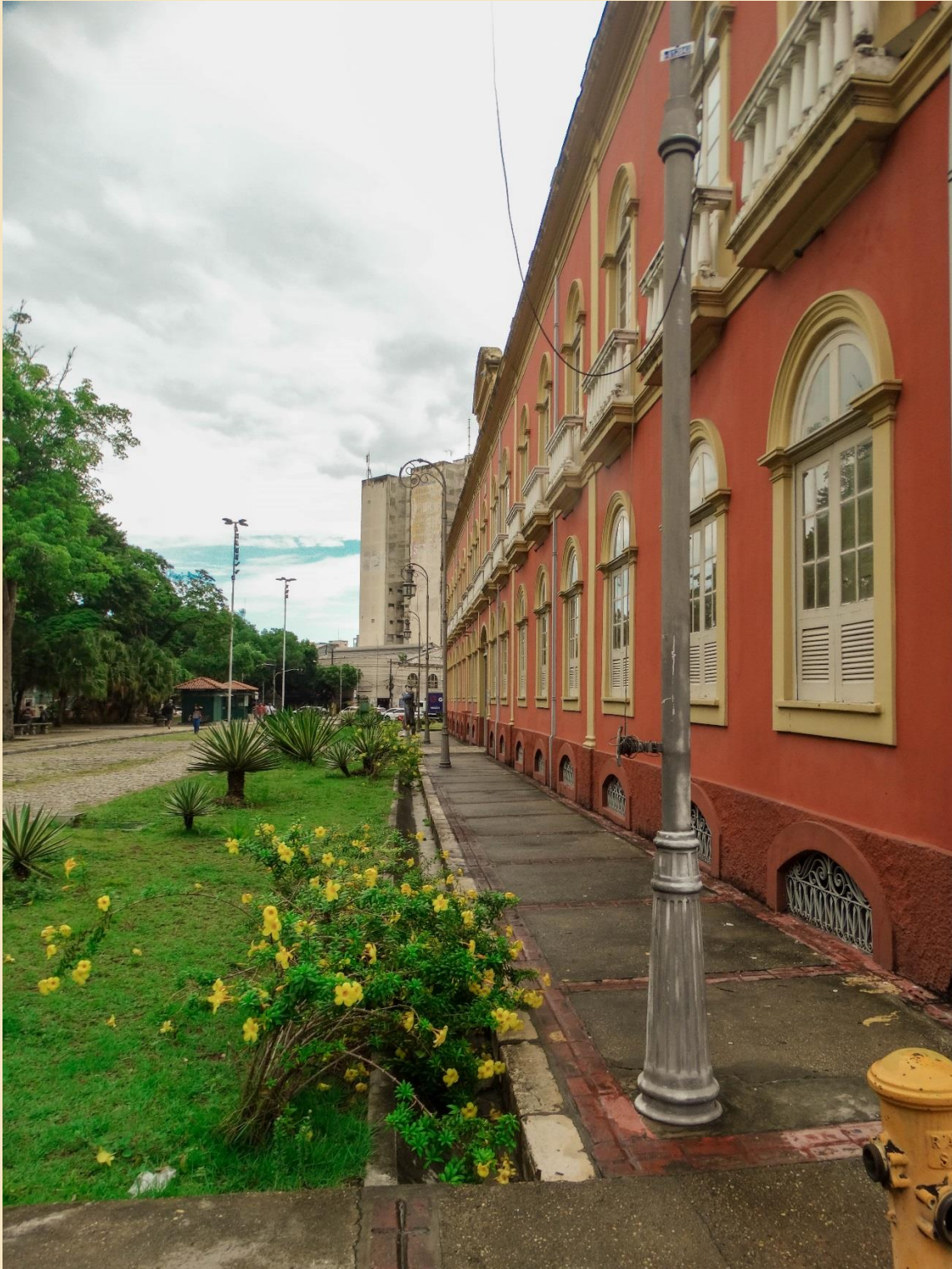
Figura 2: Praça Heliodoro Balbi – conhecida popularmente por Praça da Polícia em Manaus. Um patrimônio histórico e foi palco de manifestações populares, políticas, religiosas e sociais. Fica em frente ao Colégio Dom Pedro II – Colégio Estadual de Manaus.