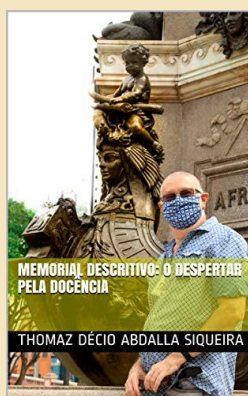
Figura 1: Livro em E-book da Defesa do Memorial na FEF/UFAM.