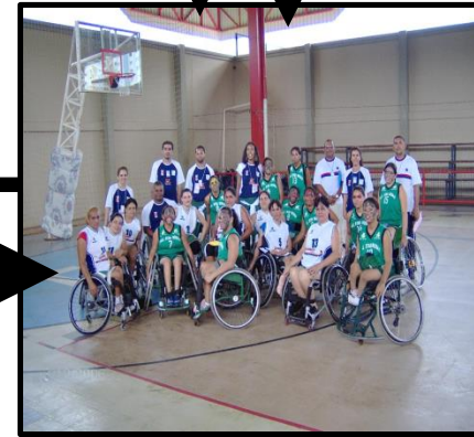
Esporte de Reabilitação