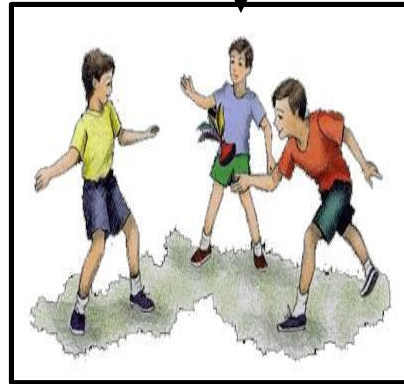
Esporte de Recreação e tempos livres