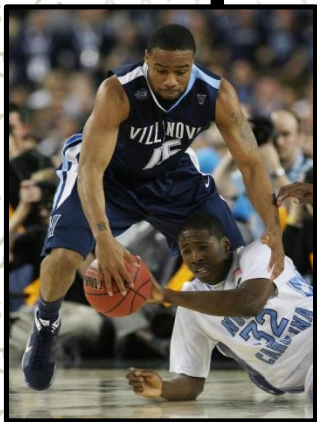
Esporte de Excelência ou alto rendimento

Verificamos inclusive a possibilidade natural de intercâmbio entre as diferentes formas de prática esportiva: