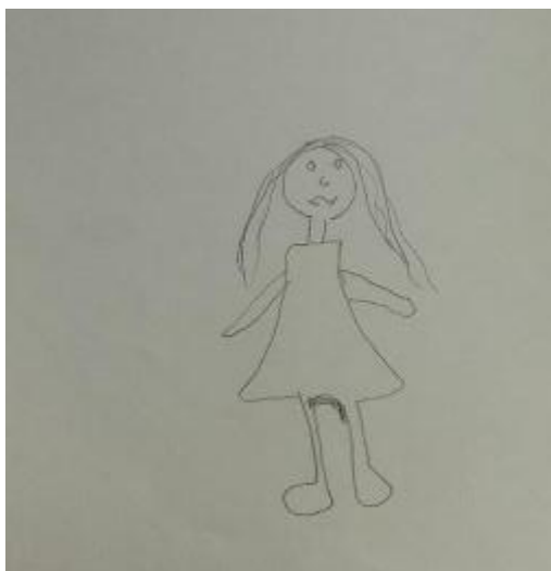
Figura 04 – Mulher com endometriose

trabalho enquanto uma vivência angustiante. Isso tudo acontecendo num espaço social fortemente estruturado em torno de valores corporativos como a discrição, elegância, asseio, compostura. Lugar em que o controle social dado pelo olhar do outro pode ser massacrante.