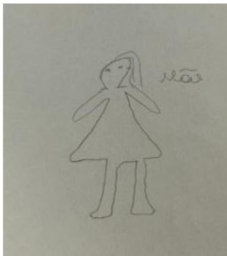
Figura 05 – Mãe, meu apoio

estou passando mal (...), porque tudo é julgamento. Raramente é acolhimento” (Mulher A). Aparece aí um sentido de incompreensão e desconexão com o outro, com o retorno à formas mais infantis e regressivas de vinculação.