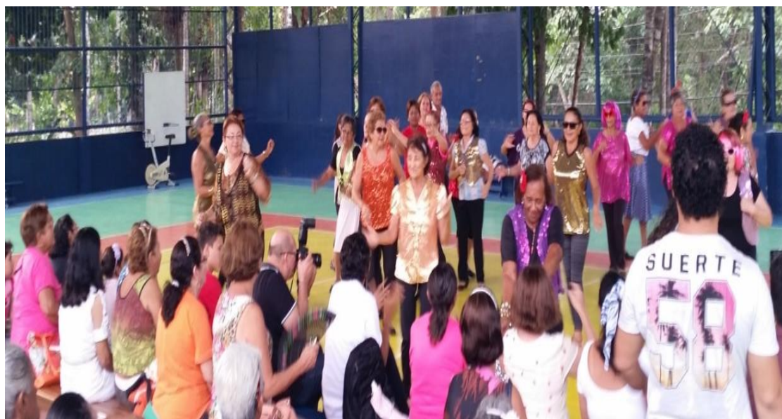
Figura 14: Acadêmicas 3IA de Dança Gerontológica apresentando uma coreografia

E para finalizar as apresentações, as turmas 1 e 2 de Hidromotricidade Gerontológica matutino apresentaram um lindo musical.