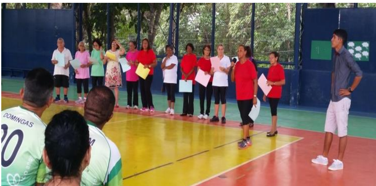
Figura 11: Acadêmicos 3IA de Musculação Gerontologica

Continuando com as apresentações a de número treze foi realizada pela turma 2 de Educação Física, onde realizaram uma dança.