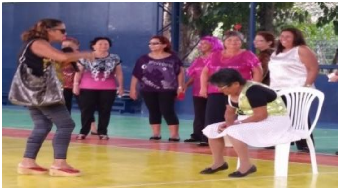
Figura 13: acadêmicas 3IA de dança apresentando um teatro.

A apresentação de número quinze foi realizada pela disciplina de dança turma 2, onde as alunas dividiram sua apresentação, dando início a uma peça e em seguida a uma coreografia.