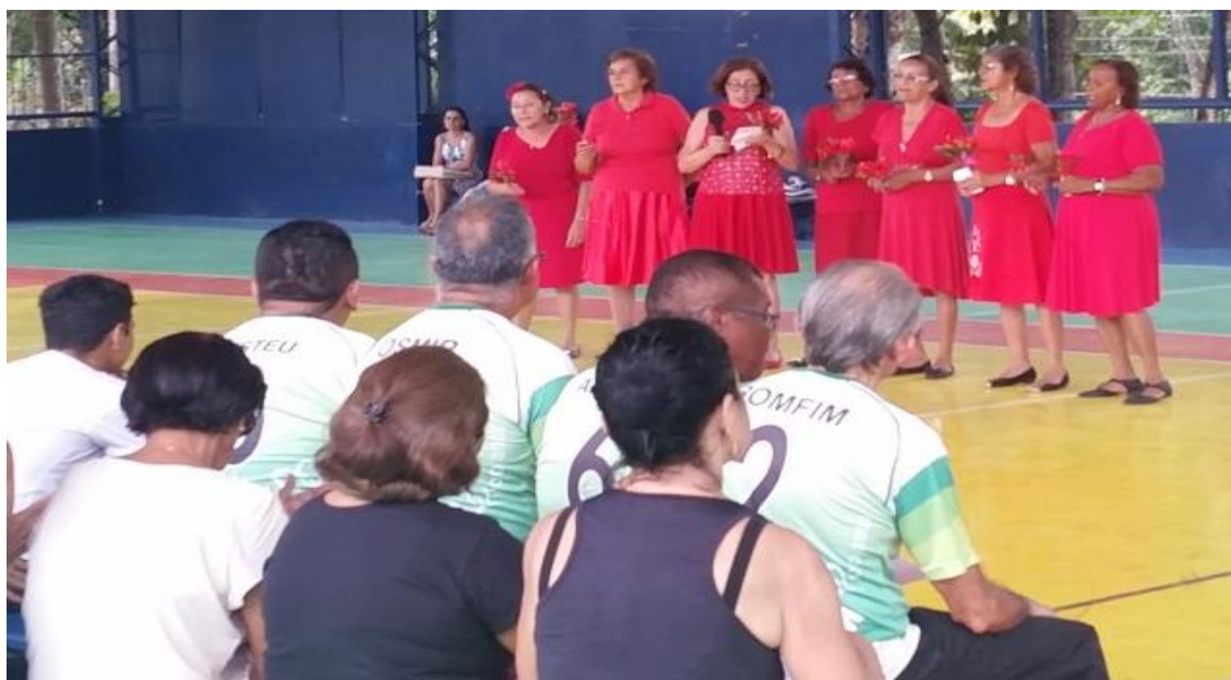
Figura 9: Apresentação das acadêmicas 3IA de Ginástica Gerontológica

A oitava apresentação foi realizada pelas alunas da Ginastica Gerontológica da turma 2, onde cantaram uma musica e distribuíram rosas ao final.