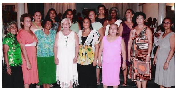
Diretoria do CATIA