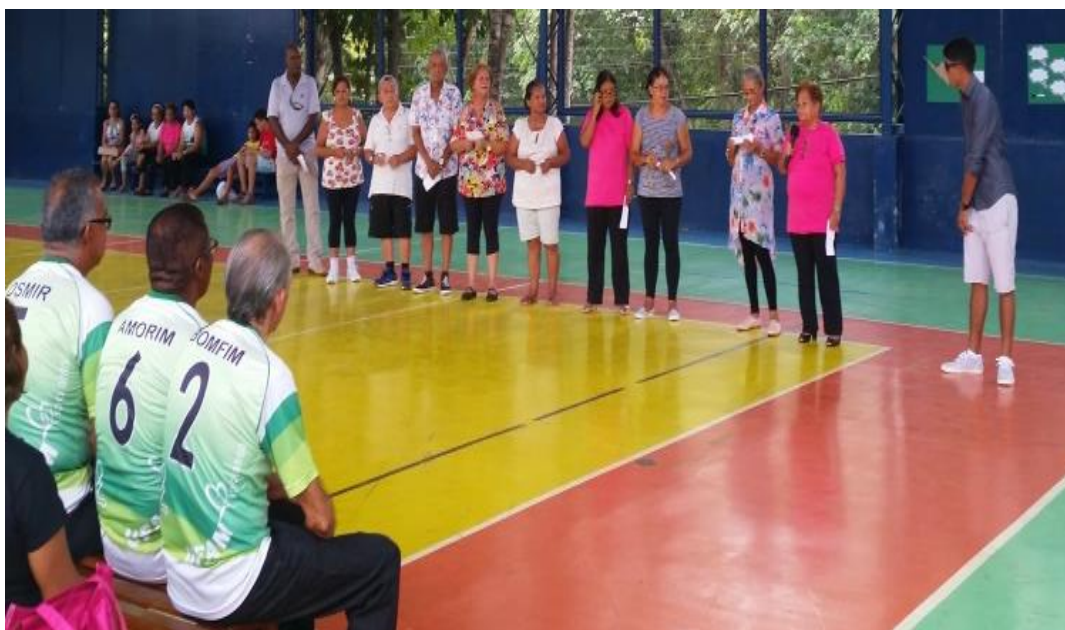
Figura 8: Jograal dos acadêmicos 3IA de Hidromotricidade Gerontológica

A oitava apresentação foi realizada pelas alunas da Ginastica Gerontológica da turma 2, onde cantaram uma musica e distribuíram rosas ao final.