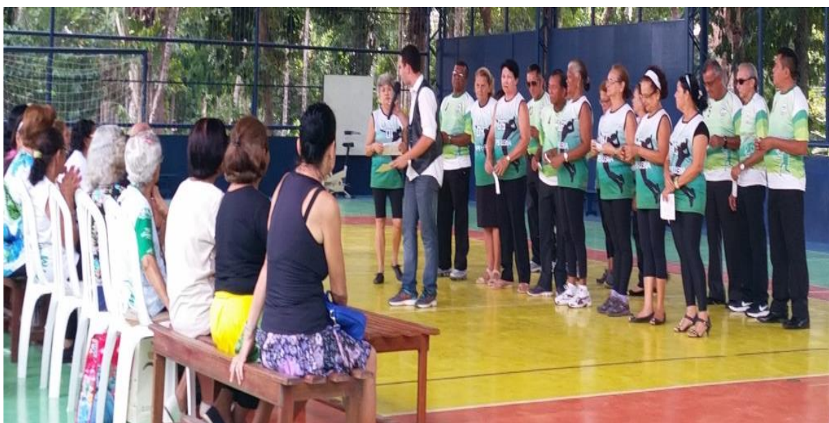
Figura 10: Jogral apresentado pelos acadêmicos 3IA do Gerontovoleibol

Na apresentação de numero onze as turmas 1 e 2 de Gerontovoleibol ministrada pelo professor Ahlan montaram um jogral falando sobre os beneficios da disciplina.