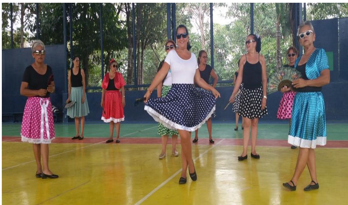
Figura 12: Acadêmicas 3IA de ginástica dançando

A turma 1 da disciplina de Ginástica Gerotológica realizou a apresentação de número quatorze, onde dançaram uma música dom john travolta, todas caracterizadas estilo anos 80.