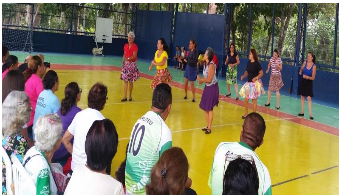
Figura 7: Dança apresentada pela turma de Musculação Gerontológica

A sexta apresentação foi da turma 1 de Musculação Gerontológica de segunda e quarta ministrada pela professora Alexia.