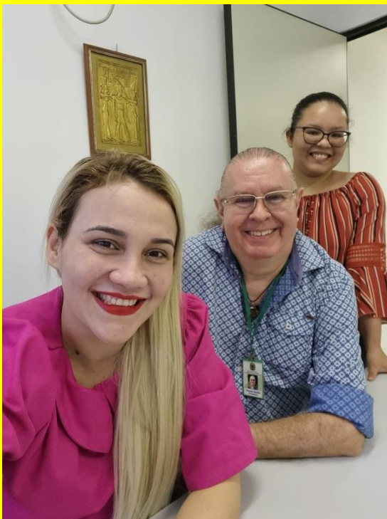
Figura 3: Membros da CPA/UFAM.