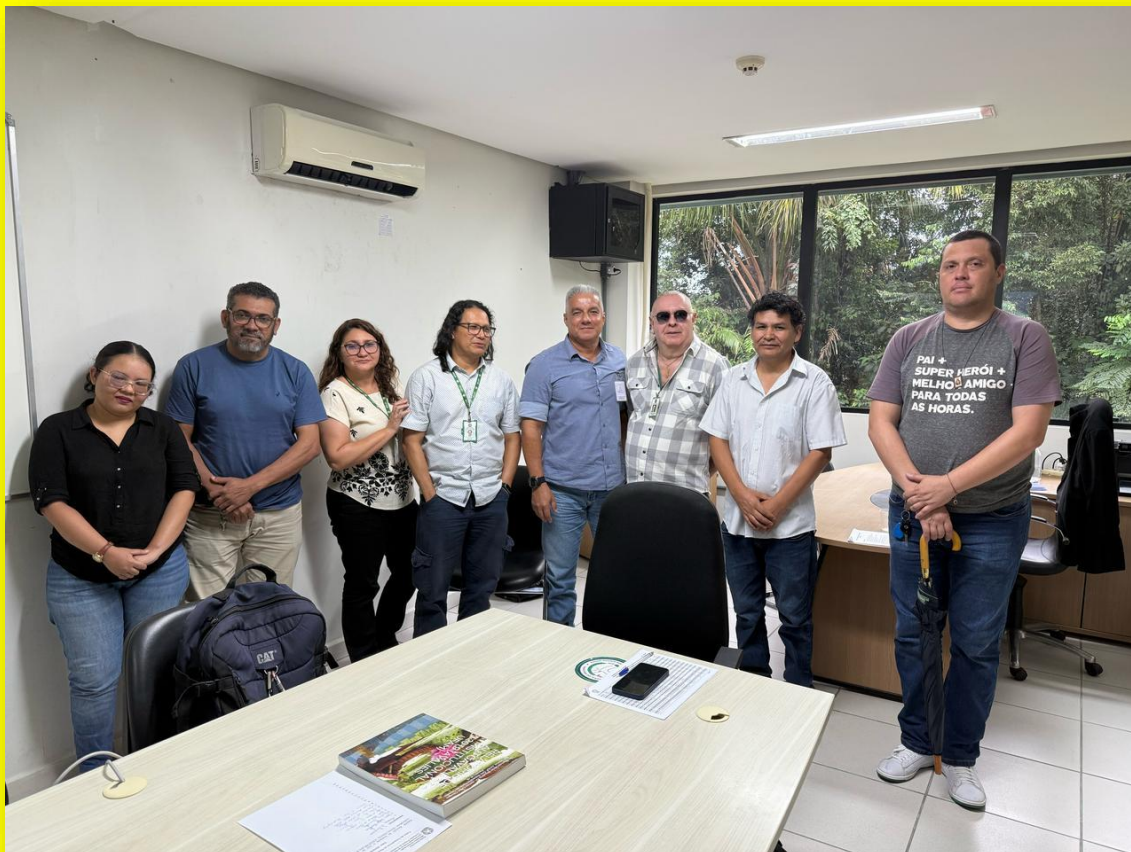
Figura 7: Equipe da CPA - Comissão Própria de Avaliação da UFAM - Universidade Federal do Amazonas.

Informamos que a maior parte das imagens publicadas na edição de abril de 2025 do Boletim Informativo Universitário de Saúde (BIUS) é de autoria dos próprios colaboradores responsáveis pelos artigos. As demais imagens integram o acervo fotográfico do Professor Especialista Kemel José Fonseca Barbosa, docente da Faculdade de Educação Física e Fisioterapia (FEFF) da Universidade Federal do Amazonas (UFAM) e membro da Comissão Própria de Avaliação (CPA/UFAM). Para contato: kemel@ufam.edu.br