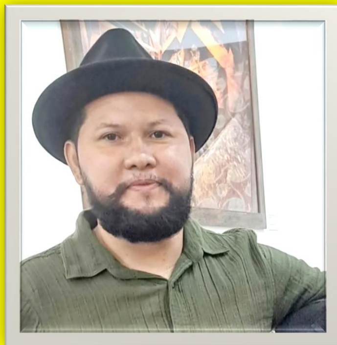
Figura 2: Autor Odnei Sales Farias. Fonte: FEFF/UFAM abril/2025.