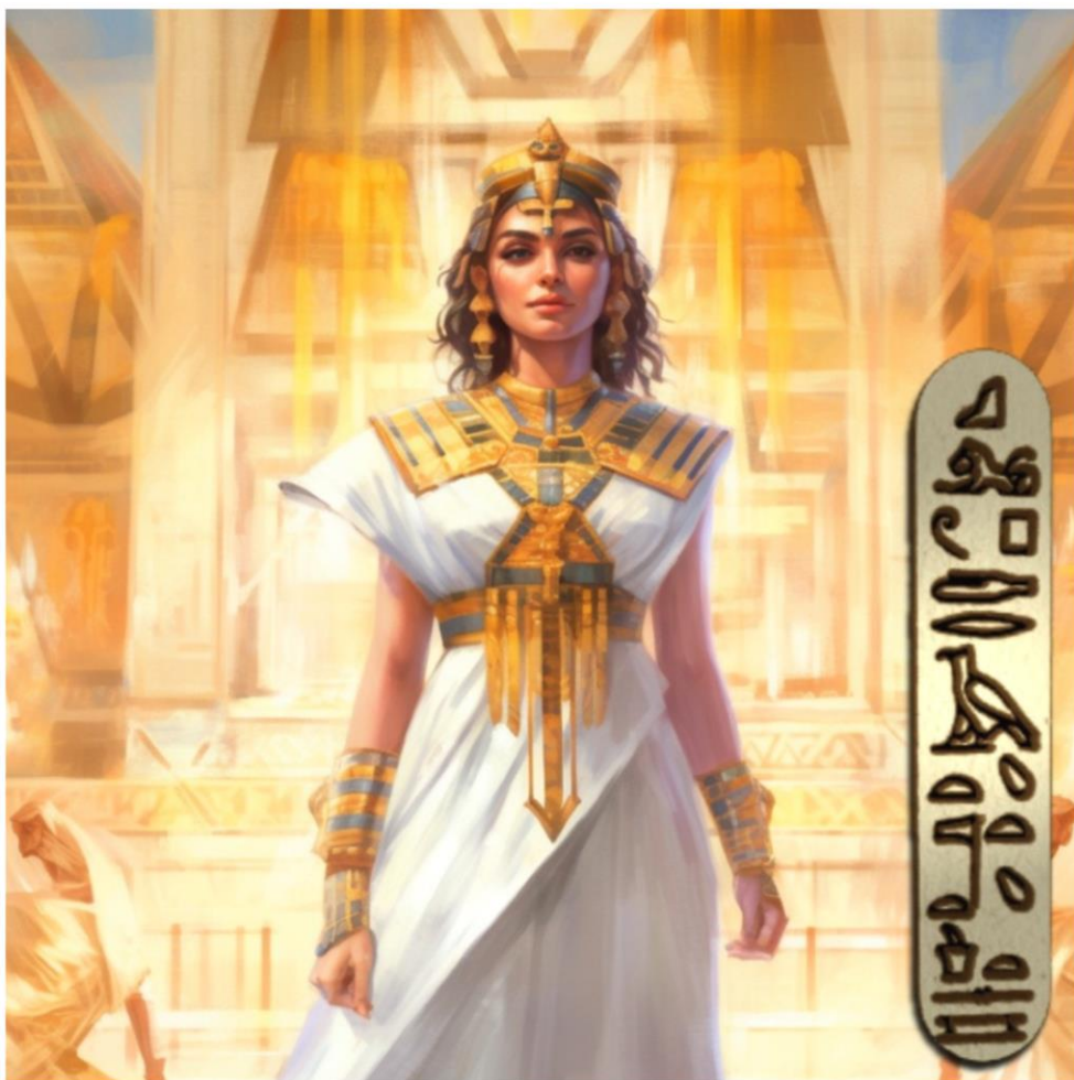
Figura 1: IN HONOREM PHARAONIS CLEOPATRAE VII

BIUS -Boletim Informativo Unimotrisaúde em Sociogerontologia