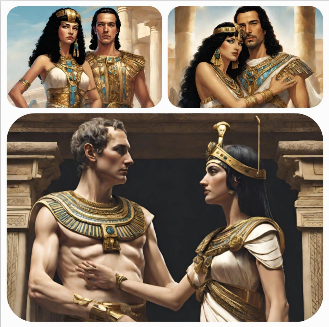
Figura 3: Faraó Cleópatra VII Thea Filopátor ((em grego clássico: Κλεοπάτρᾳ Φιλοπάτωρ).