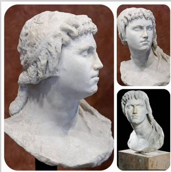
Figura 4: In honorem pharaonis Cleopatrae VII.