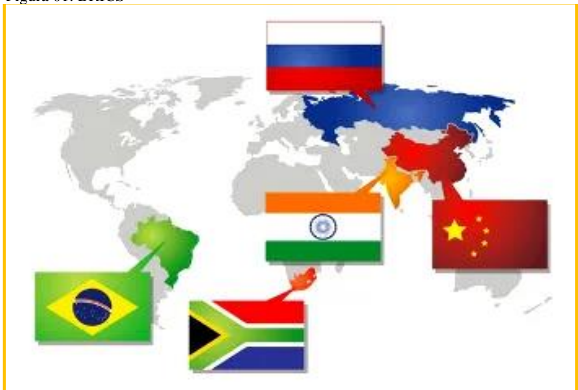
Figura 01: BRICS