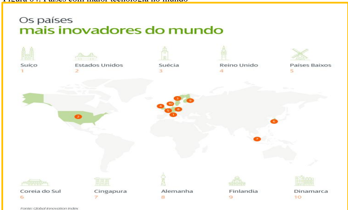
Figura 04: Países com maior tecnologia no mundo