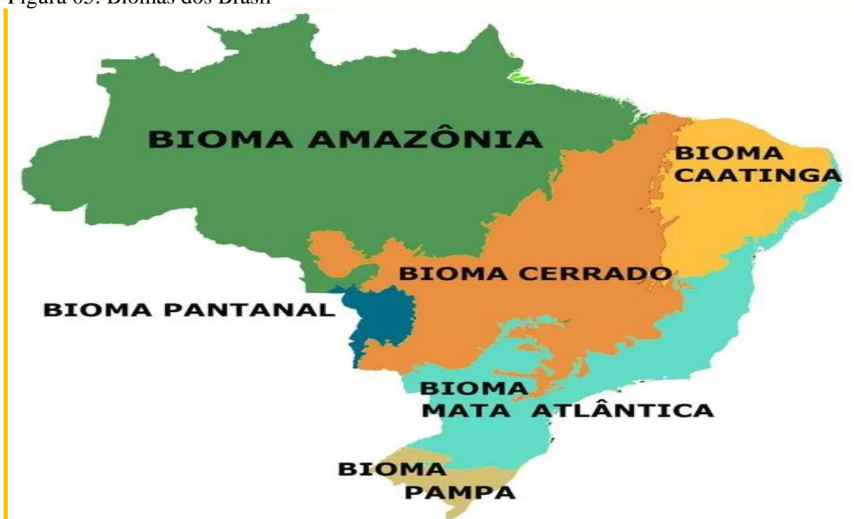
Figura 05: Biomas dos Brasil