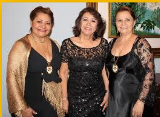
Figura 3: A professora titular da Faculdade de Educação Física e Fisioterapia da UFAM (FEEF) e docente do Programa de Pós-Graduação em Sociedade e Cultura na Amazônia (PPGSCA).

Ministrou as disciplinas Cultura Corporal dos Povos Tradicionais e Seminário de Pesquisa, no Programa de Pós-Graduação Sociedade e Cultura na Amazônia (PPGSCA) do Instituto de Filosofia, Ciências Humanas e Sociais (IFCHS); Dimensões Socioantropológicas do Esporte; Antropologia Cultural e Metodologia do Ensino da FEEF. Tem experiência na área de Educação Física, com ênfase em esporte e cultura, atuando principalmente nos temas: Estudo de Comunidade: Tradições desportivo-culturais, jogos tradicionais; Corpo: Corporeidade dos povos indígenas; rituais, estudos socioculturais e desportivos e atividade física escolar.