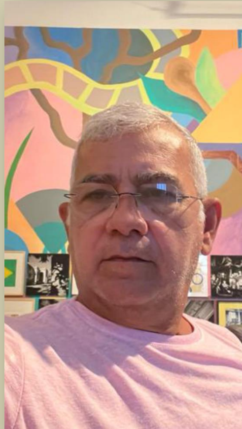
Figura 2 e 3: Comissão de organização do Salão de Arte Contemporânea da Academia Amazonense de Letras.

A Comissão Própria de Avaliação – CPA da Universidade Federal do Amazonas – UFAM parabeniza o agraciado na amostra do Salão de Artes no ICBEU – Instituto Cultural Brasil – Estados Unidos 1 em Manaus – AM.