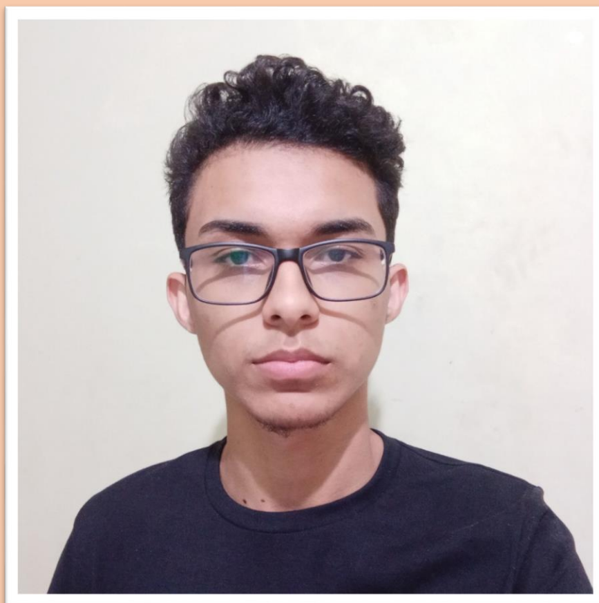
Figure 3 - Faculdade de Tecnologia, Engenharia da Computação, Universidade Federal do Amazonas, AM. - Departamento de Eletrônica e Computação, Faculdade de Tecnologia, Universidade Federal do Amazonas, AM. Fabrício C. Guimarães.

Fotos de alguns autores do Artigo 8 do BIUS :