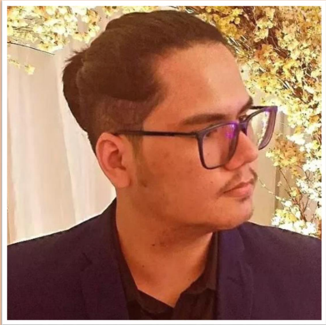
Figure 5- Faculdade de Tecnologia, Engenharia da Computação, Universidade Federal do Amazonas, AM. - Departamento de Eletrônica e Computação, Faculdade de Tecnologia, Universidade Federal do Amazonas, AM. João V. Marques.