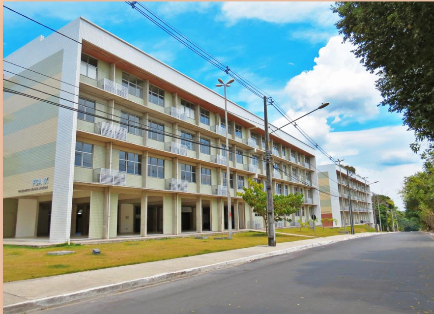
Figura 2 – Campus Universitário da UFAM setor Sul (KEMEL BARBOSA, 2022).

Magno Oliveira https://www.pensador.com/poemas_da_amazonia/ (Disponível em 08/06/2022):