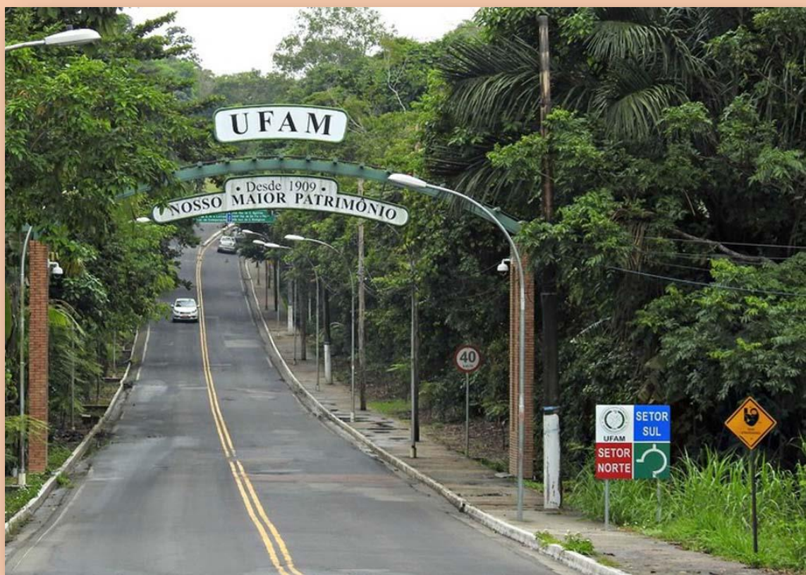
Figura 1 – Entrada principal do Campus Universitário da Universidade Federal do Amazonas - UFAM.

BIUS -Boletim Informativo Unimotrisaúde em Sociogerontologia